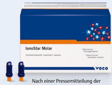
Nach einer Pressemitteilung der VOCO GmbH, Cuxhaven Internet: www.voco.de

sche wie haltbare Restaurationen schnell und einfach herstellen. IonoStar Molar eignet sich für Füllungen von nicht okklusionstragenden Kavitäten der Klasse I, semipermanente Füllungen von Kavitäten der Klasse I und II, Füllungen von Zahnhalsläsionen, Klasse-V-Kavitäten, Behandlung von Wurzelkaries, Füllungen von Klasse-III-Kavitäten, Restauration von Milchzähnen, als Unterfüllung bzw. Liner, für den Stumpfaufbau sowie für temporäre Füllungen.