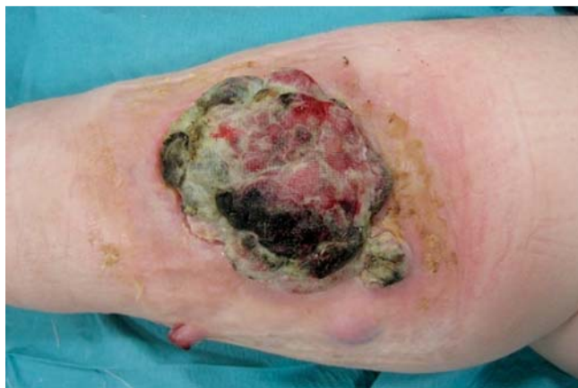
Abb. 1 Exophytisch wachsendes Melanom am linken Unterschenkel. Aufnahme bei Erstvorstellung der Patientin im Juli 2013.