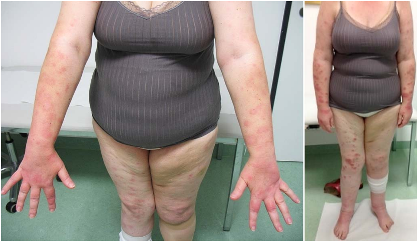
Abb. 6 Verlaufskontrolle 10 Tage nach Einleitung der systemischen Therapie mit Steroiden und NSAR (links), zum Vergleich Befund vor Therapiebeginn (rechts).