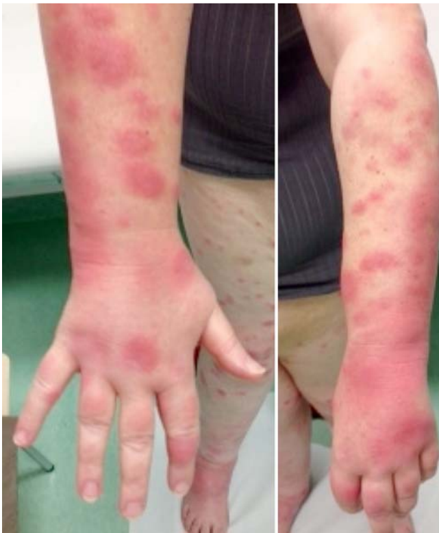
Abb. 5 Symmetrische Gelenkschwellung und Arthralgien der Hand- und Fingergelenke.