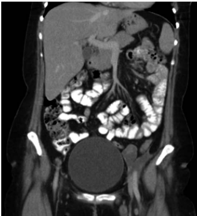
Abb. 7 Aufnahmen vom Abdomen drei Monate nach Beginn der Therapie mit Vemurafenib.