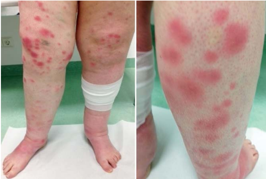
Abb. 4 Subkutane, infiltrierte, druckdolente Knoten an den unteren Extremitäten.