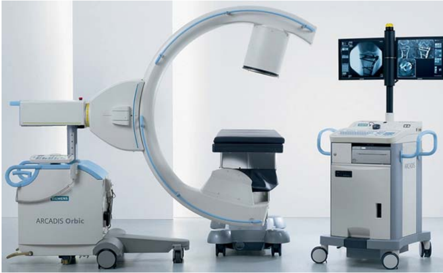
Abb. 1 3-D-C-Bogen zur Durchführung von intraoperativen 3-D-Scans.