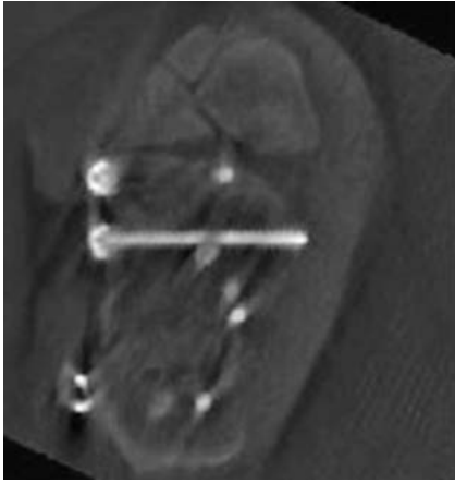
Abb. 3 Darstellung einer Schraube in voller Länge zur Beurteilung der Lage.

Artefakte können die intraoperative Bildbeurteilung einschränken. Durch eine regelrechte Lagerung und Einstellung des 3-D-Bogens können diese reduziert werden.