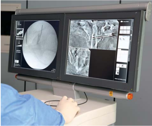
Abb. 7 Bearbeitung des Datensatzes durch den Operateur und Einstellung der Standardebenen.