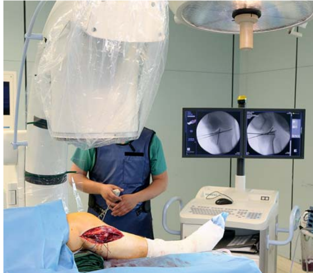
Abb. 4 Darstellung der Region zur Beurteilung der Größe des Bildausschnitts in 2 Ebenen.

Die Durchführung eines 3-D-Scans erfordert vom Operationsteam Routine im Umgang mit dem System und bedarf