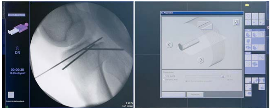
Abb. 5 Einstellen der Position des 3-D-C-Bogens und der Lage des Patienten.

mehr Zeit als eine konventionelle Kontrolle mit einem 2-D-Bildverstärker.