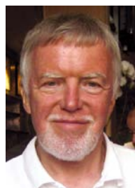
Mit den besten Grüßen

Last but not least empfehle ich die Ankündigung des Emders Workshops Ihrer Aufmerksamkeit!