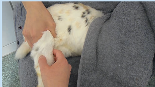
Abb. 1b Der Probennehmer nimmt gegenüber Platz und fühlt zunächst, ob sich die Vene anstaut (manchmal muss der Helfer die Stauposition noch leicht ändern). Im Gegensatz zur Entnahme bei Hund und Frettchen wird die V. saphena nicht direkt laterodorsal des Tarsalgelenks punktiert, sondern je nach Größe des Tieres ca. 3–5 cm weiter oberhalb, wo sie unter den Sehnen hervortritt und nach kaudodorsal abbiegt.

Abb. 1a Das Tier wird in Brust- oder Seitenlage gelagert. Während eine Hand das Kaninchen im Schulterbereich fixiert, streckt die andere Hand das Hinterbein mit leichtem Druck im Kniescheibenbereich und staut gleichzeitig mit dem Zeigefinger die nach kaudal ziehende Vene. Die Lagerung kann auf dem Schoß oder Arm der Hilfsperson oder auf dem Tisch erfolgen. Bei der Lagerung mit abgedecktem Kopf auf dem Schoß scheint der Körperkontakt, die Tiere zu beruhigen und ermöglicht es dem Helfer, bereits kleine Bewegungen früher abzufangen [5].