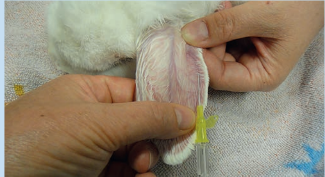
Abb. 2b Die Haut wird zunächst mit vorgeschobenem Mandrin punktiert. Sobald Blut in den Katheter gelangt, wird der Mandrin leicht zurückgezogen, um ein erneutes Durchstechen zu vermeiden. Der Katheter wird erst dann komplett in die Vene vorgeschoben. Erschweren Venenklappen das Vorschieben, wird der Mandrin vorsichtig entfernt und Spüllösung (0,9% NaCl) durch den Katheter gespült, um die Klappen zu öffnen und somit das Vorschieben zu ermöglichen.

Abb. 2a Die Kaudalkante des Ohres wird an der Basis gestaut. Die Verwendung von lokalanästhetischen Cremes oder eine leichte Hyperämisierung können die Darstellung zusätzlich erleichtern. Falls erforderlich, werden Haare über der Vene entfernt und die Punktionsstelle desinfiziert. Punktiert wird so weit unten wie möglich, damit der Venenkatheter gerade liegt und gut fixiert werden kann. Die zentral verlaufende A. auricularis darf nicht für Katheter genutzt werden, da es zur Nekrose in der Peripherie des Ohres kommen kann.