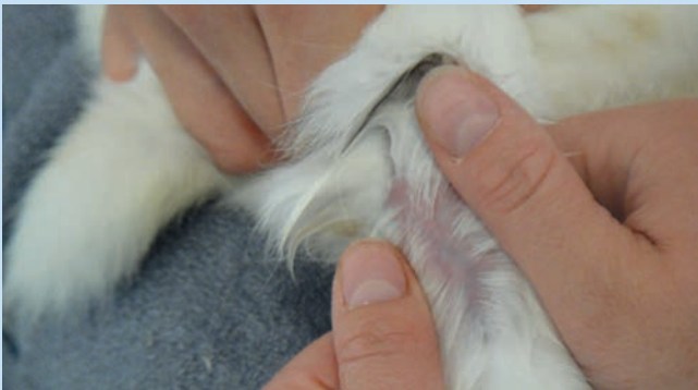
Abb. 1c Das Fell an der Punktionsstelle wird mit Alkohol befeuchtet und über der Vene in einem Verlauf von 2–3 cm gescheitelt. Ein Scheren ist nicht erforderlich. Die Vene ist dann gut in ihrem Verlauf von kranioventral nach kaudodorsal zu sehen.

Abb. 1b Der Probennehmer nimmt gegenüber Platz und fühlt zunächst, ob sich die Vene anstaut (manchmal muss der Helfer die Stauposition noch leicht ändern). Im Gegensatz zur Entnahme bei Hund und Frettchen wird die V. saphena nicht direkt laterodorsal des Tarsalgelenks punktiert, sondern je nach Größe des Tieres ca. 3–5 cm weiter oberhalb, wo sie unter den Sehnen hervortritt und nach kaudodorsal abbiegt.