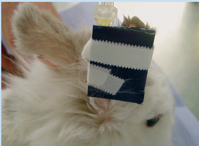
Abb. 2c Wenn der Katheter sitzt, wird er mittels Klebestreifen fixiert und durch ein untergelegtes Stück Pappe oder eine Verbandsrolle stabilisiert.

Abb. 2b Die Haut wird zunächst mit vorgeschobenem Mandrin punktiert. Sobald Blut in den Katheter gelangt, wird der Mandrin leicht zurückgezogen, um ein erneutes Durchstechen zu vermeiden. Der Katheter wird erst dann komplett in die Vene vorgeschoben. Erschweren Venenklappen das Vorschieben, wird der Mandrin vorsichtig entfernt und Spüllösung (0,9% NaCl) durch den Katheter gespült, um die Klappen zu öffnen und somit das Vorschieben zu ermöglichen.