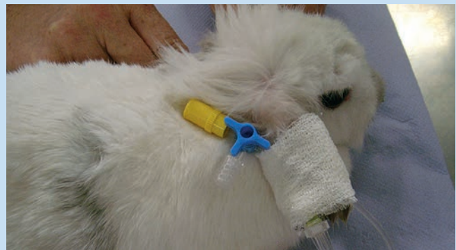
Abb. 2d Will man vermeiden, dass der Venenkatheter beim An- und Abschrauben der Infusion in seiner Position verschoben wird, bietet es sich an, einen vorgefluteten Verlängerungsschlauch am Katheter zu befestigen, der dann in den Verband integriert und im Nackenbereich fixiert wird. Der Verband sollte zum Schluss die gesamte Schlauchschlinge umfassen, um ein Hineintreten zu verhindern.

Abb. 2c Wenn der Katheter sitzt, wird er mittels Klebestreifen fixiert und durch ein untergelegtes Stück Pappe oder eine Verbandsrolle stabilisiert.