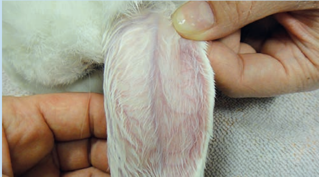
Abb. 2a Die Kaudalkante des Ohres wird an der Basis gestaut. Die Verwendung von lokalanästhetischen Cremes oder eine leichte Hyperämisierung können die Darstellung zusätzlich erleichtern. Falls erforderlich, werden Haare über der Vene entfernt und die Punktionsstelle desinfiziert. Punktiert wird so weit unten wie möglich, damit der Venenkatheter gerade liegt und gut fixiert werden kann. Die zentral verlaufende A. auricularis darf nicht für Katheter genutzt werden, da es zur Nekrose in der Peripherie des Ohres kommen kann.

Die Venae auriculares des Kaninchens eignen sich gut für das Legen von Venenverweilkathetern und für die Entnahme kleinerer Blutmengen. Größere Blutmengen sind wegen der vorhandenen Venenklappen und des schnellen Kollabierens eher selten zu gewinnen [7]. Zum Legen eines Venenverweilkatheters (22–24 G, Kennfarbe Gelb oder Blau) an der V. auricularis wird das Kaninchen in sitzender Position auf dem Tisch fixiert.