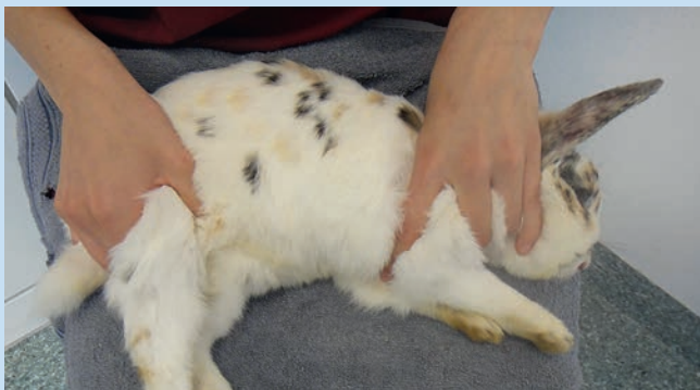
Abb. 1a Das Tier wird in Brust- oder Seitenlage gelagert. Während eine Hand das Kaninchen im Schulterbereich fixiert, streckt die andere Hand das Hinterbein mit leichtem Druck im Kniescheibenbereich und staut gleichzeitig mit dem Zeigefinger die nach kaudal ziehende Vene. Die Lagerung kann auf dem Schoß oder Arm der Hilfsperson oder auf dem Tisch erfolgen. Bei der Lagerung mit abgedecktem Kopf auf dem Schoß scheint der Körperkontakt, die Tiere zu beruhigen und ermöglicht es dem Helfer, bereits kleine Bewegungen früher abzufangen [5].