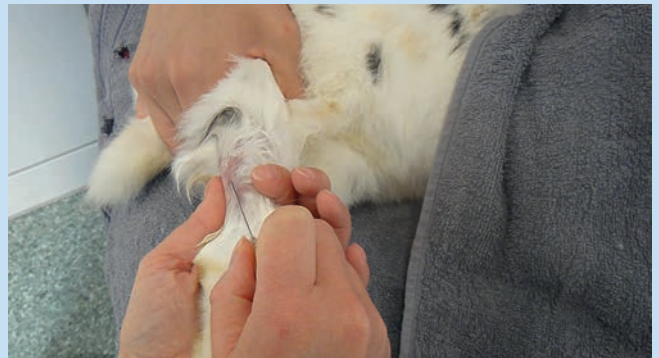
Abb. 1d Punktiert wird im flachen Winkel in kaudodorsale Richtung. Die Haut über der Punktionsstelle wird beim Einstich leicht über der Vene gespannt, um ein Wegrollen der Venen zu verhindern, danach aber wieder losgelassen.

Abb. 1c Das Fell an der Punktionsstelle wird mit Alkohol befeuchtet und über der Vene in einem Verlauf von 2–3 cm gescheitelt. Ein Scheren ist nicht erforderlich. Die Vene ist dann gut in ihrem Verlauf von kranioventral nach kaudodorsal zu sehen.