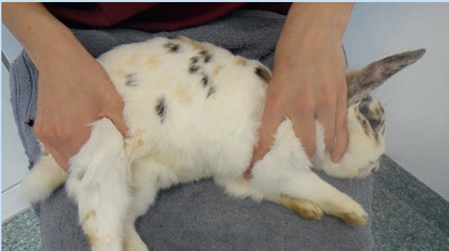
Abb. 1a Das Tier wird in Brust- oder Seitenlage gelagert. Während eine Hand das Kaninchen im Schulterbereich fixiert, streckt die andere Hand das Hinterbein mit leichtem Druck im Kniescheibenbereich und staut gleichzeitig mit dem Zeigefinger die nach kaudal ziehende Vene. Die Lagerung kann auf dem Schoß oder Arm der Hilfsperson oder auf dem Tisch erfolgen. Bei der Lagerung mit abgedecktem Kopf auf dem Schoß scheint der Körperkontakt, die Tiere zu beruhigen und ermöglicht es dem Helfer, bereits kleine Bewegungen früher abzufangen [5].