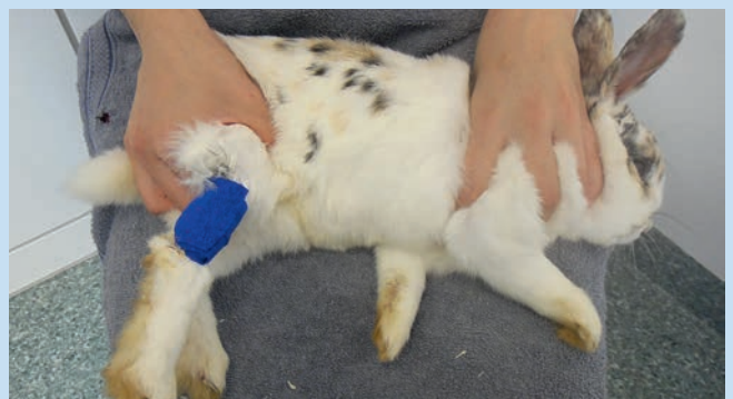
Abb. 1f Wurde ausreichend Blut gewonnen, vermindert der Helfer auf Ansage die Stauung (lässt das Bein aber in keinem Fall los!), damit die Kanüle gezogen und kurzzeitig (einige Minuten) ein Verband angelegt werden kann.

Abb. 1e Die Lage der Kanüle ist richtig, wenn diese einige Millimeter weit unter der Haut liegt und eine direkte, gerade Verlängerung der Vene darstellt, und wenn das Blut gleichmäßig abtropft. Ist die Kanüle gut platziert, muss sie nicht festgehalten werden. Auch das Bein wird nicht vom Entnehmer gehalten, sondern bleibt durch das Strecken des Helfers in Position, sodass der Entnehmer beide Hände frei hat. Da die meisten Gerinnungsfaktoren in den ersten Tropfen sind, sollte immer mit einem Serum- oder Lithium-Heparin-Röhrchen begonnen und ein EDTA-Röhrchen zwischendurch befüllt werden [6].