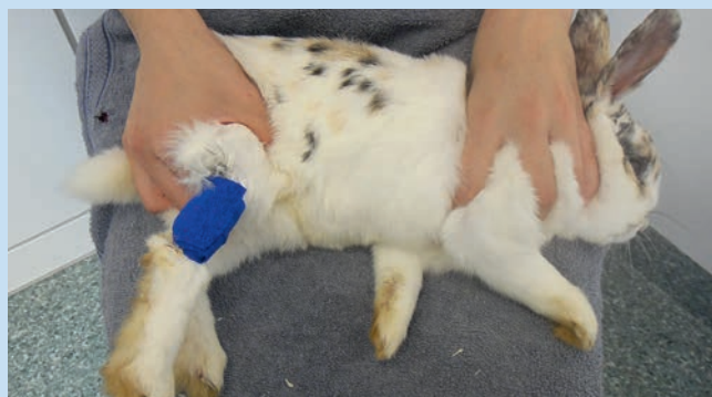
Abb. 1f Wurde ausreichend Blut gewonnen, vermindert der Helfer auf Ansage die Stauung (lässt das Bein aber in keinem Fall los!), damit die Kanüle gezogen und kurzzeitig (einige Minuten) ein Verband angelegt werden kann.

Abb. 1e Die Lage der Kanüle ist richtig, wenn diese einige Millimeter weit unter der Haut liegt und eine direkte, gerade Verlängerung der Vene darstellt, und wenn das Blut gleichmäßig abtropft. Ist die Kanüle gut platziert, muss sie nicht festgehalten werden. Auch das Bein wird nicht vom Entnehmer gehalten, sondern bleibt durch das Strecken des Helfers in Position, sodass der Entnehmer beide Hände frei hat. Da die meisten Gerinnungsfaktoren in den ersten Tropfen sind, sollte immer mit einem Serum- oder Lithium-Heparin-Röhrchen begonnen und ein EDTA-Röhrchen zwischendurch befüllt werden [6].