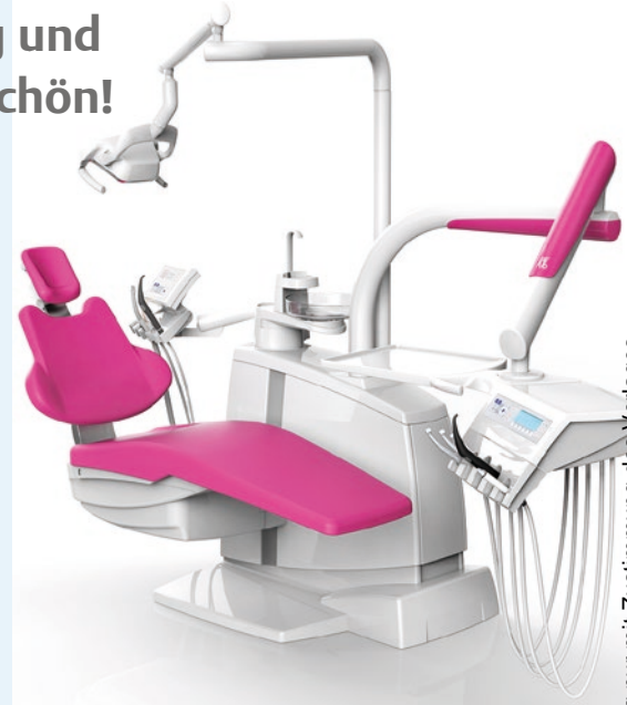
Dieses Dokument wurde zum persönlichen Gebrauch heruntergeladen. Vervielfältigung nur mit Zustimmung des Verlages.

Nach einer Pressemitteilung der KaVo Dental GmbH, Biberach / Riss