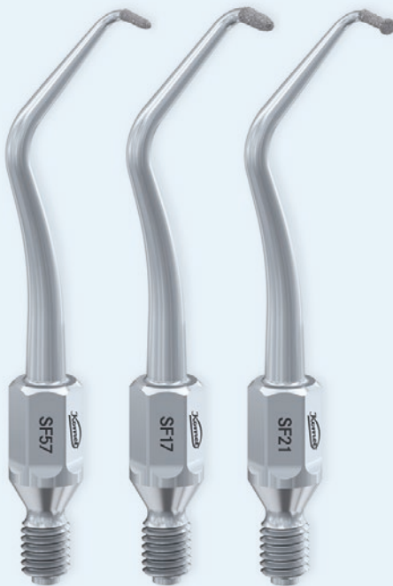
Nach einer Pressemitteilung der Komet Dental Gebr. Brasseler GmbH & Co. KG, Lemgo Internet: www.kometdental.de

Sieben diamantierte Schallspitzen für die retrograde Wurzelkanalaufbereitung ergänzen die bewährte SonicLine von Komet im Rahmen der Wurzelspitzenresektion. Nach der Präparation eines Knochenfensters und der Resektion der Wurzelspitze helfen sie bei der Auffindung und Darstellung der Kanaleingänge, Präparation der Kavität, Eröffnung und Erweiterung sehr starker Wurzelkrümmungen im Frontzahnbereich und bei der Präparation des Unterschnittes zur Retention der retrograden Wurzelfüllung. Die Spitzen stehen rechts und links gebogen zur Verfügung, bieten also gute Ergonomie, um in allen Kieferbereichen optimal arbeiten zu können. Sie ermöglichen ein minimal-invasives Vorgehen ohne Präparation von großen Knochenfenstern, bieten eine achsengerechte Bearbeitung und gute Sicht. Komet empfiehlt, die neuen Spitzen im Schallhandstück SF1LM in Betrieb zu nehmen.