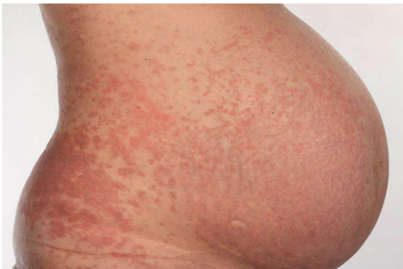
Abb. 7 Polymorphes Exanthem der Schwangerschaft.

sen und ekzematösen Veränderungen und gelegentlich auch Bläschen [17].