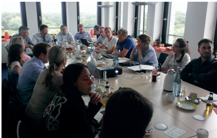
Das Junge Forum diskutierte in Berlin angeregt über bestehende und neue Projekte.

Die YOUngsters sollen weiterentwickelt werden, um den bevorstehenden und wachsenden Aufgaben gerecht zu werden. Wir freuen uns bereits jetzt, weitere interessierte Studierende für die YOUngsters