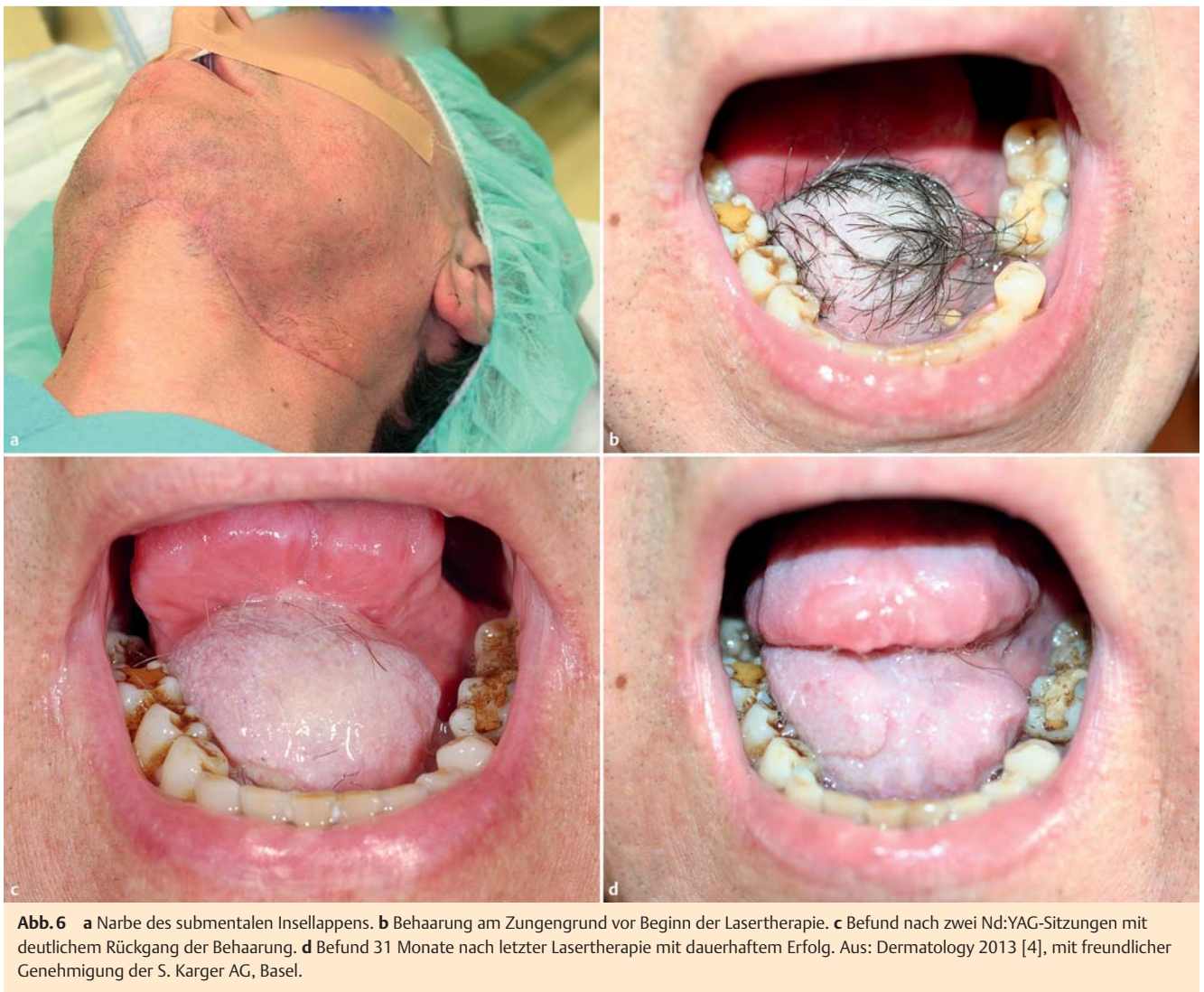
Abb. 6 a Narbe des submentalen Insellappens. b Behaarung am Zungengrund vor Beginn der Lasertherapie. c Befund nach zwei Nd:YAG-Sitzungen mit deutlichem Rückgang der Behaarung. d Befund 31 Monate nach letzter Lasertherapie mit dauerhaftem Erfolg.