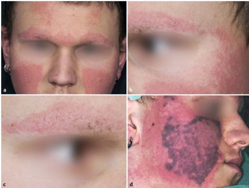
Abb. 1 a Gesichtserythem mit hyperkeratotischen Papeln. b Detail der linken Wange mit hyperkeratotischen Papeln. c Rechte Augenbraue mit lateraler Alopezie. d Dunkle Sofortpurpura direkt nach Lasertherapie. Aus: Kaune KM, Haas E, Emmert S, Schön MB, Zutt M. Successful treatment of severe keratosis pilaris rubra with a 595-nm pulsed dye laser. Dermatol Surg 2009; 35 (10): 1592 – 1595 [1].