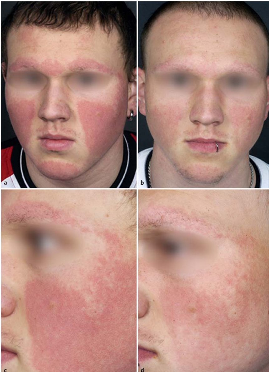
Abb. 2 a, c Keratosis rubra pilaris und Ulerythema ophryogenes als Ausgangsbefund; b, d nach 7 Laserbehandlungen mit deutlicher Aufhellung des Erythems. Aus: Kaune KM, Haas E, Emmert S, Schön MB, Zutt M. Successful treatment of severe keratosis pilaris rubra with a 595-nm pulsed dye laser. Dermatol Surg 2009; 35 (10): 1592 – 1595 [1].