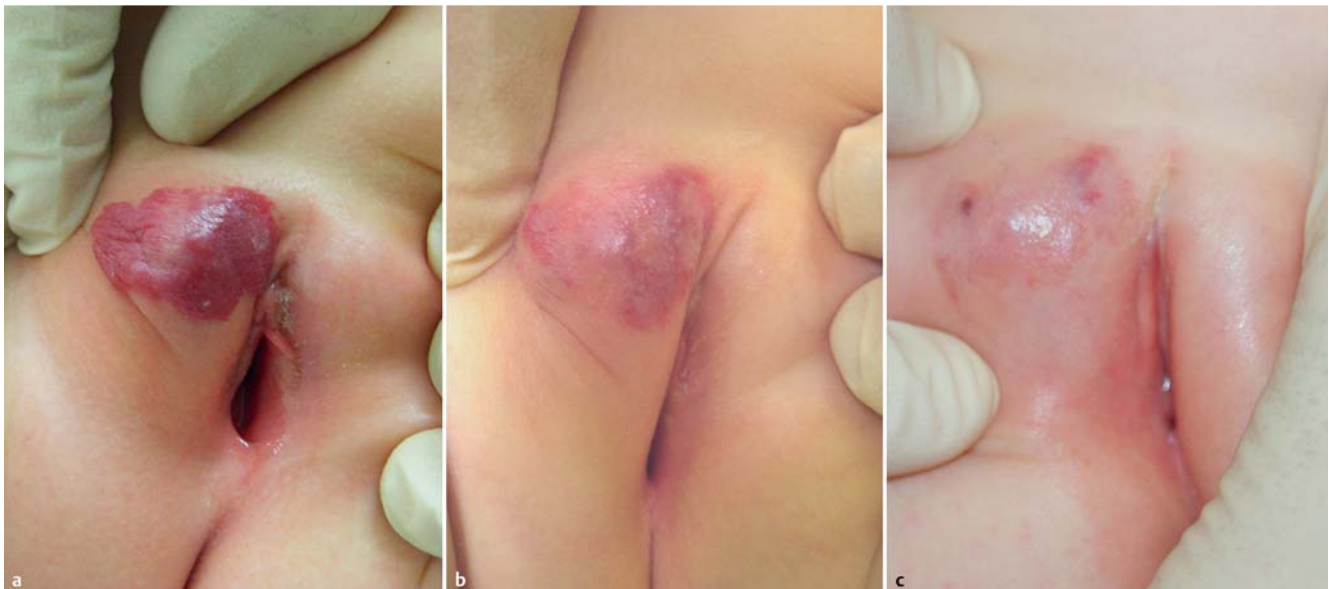
Abb. 8 a Genitales Hämangiom bei einem Mädchen, Ausgangsstatus. Deutliche Befundbesserung nach (b) 1 und (c) 2 Behandlungssitzungen.