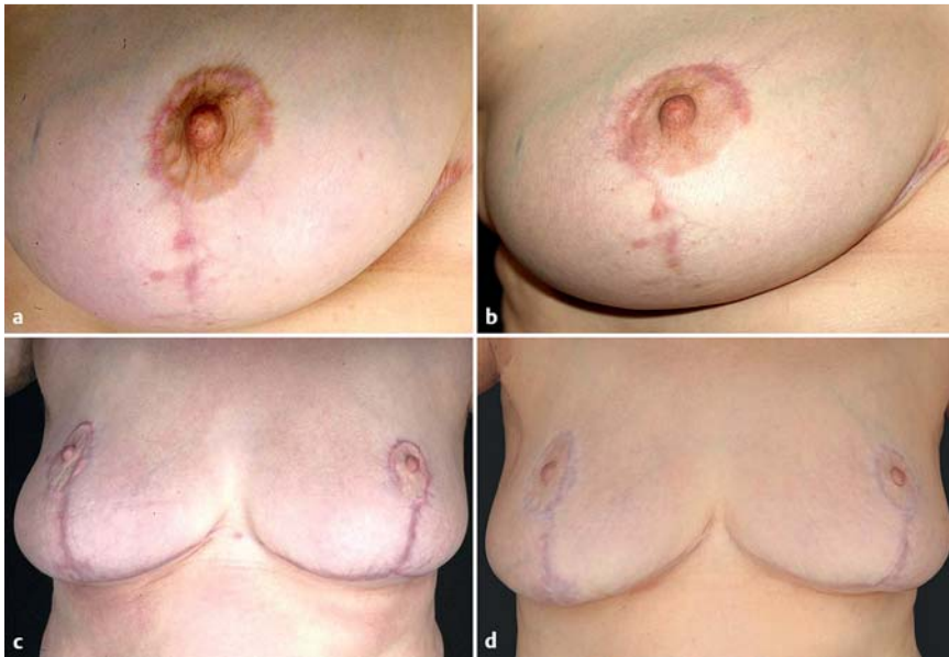
Abb. 4 a, c Hypertrophe Narben vor Therapie. b, d Nach Kombinationstherapie mit deutlicher Abflachung der Narben und Reduktion der Rötung. Aus: Eur J Dermatol [3].