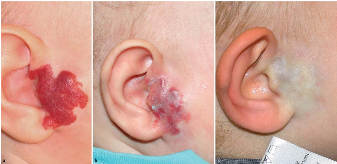
Abb. 7 a Präaurikuläres Hämangiom, Ausgangsstatus. b Aufhellung bereits nach einer kombinierten Laserbehandlung mit dem Farbstofflaser und dem Nd:YAG-Laser. c Zustand nach 3 Sitzungen mit nahezu kompletter Aufhellung. © Deutsche Dermatologische Gesellschaft (DDG). Published by John Wiley & Sons Ltd. | JDDG | 1610–0379/2014 [5].