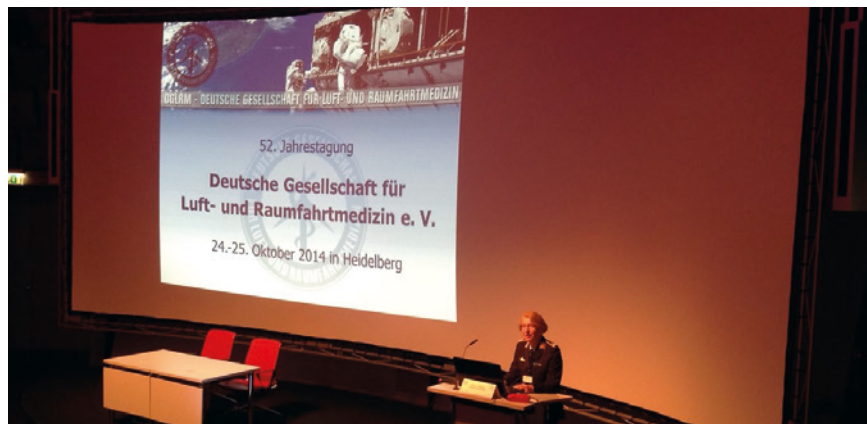
Eröffnung der Jahrestagung der DGLRM.

Unsere alljährliche Mitgliederversammlung fand am Abend des ersten Kongress-tages statt. Im Mittelpunkt standen die Rechenschaftslegung des Vorstands und der Arbeitsgruppenleiter über die im letzten Jahr geleistete Arbeit sowie Überlegungen zum sparsamen Umgang mit den Mitteln der Gesellschaft, um dem eigentlichen Ziel der Gesellschaft, der Förderung der Wissenschaft auf dem Gebiet der Luft- und Raumfahrtmedizin, besser gerecht werden zu können. Nähere Einzelheiten dazu finden Sie im Protokoll der Mitgliederversammlung in der vorliegenden Ausgabe der FTR.