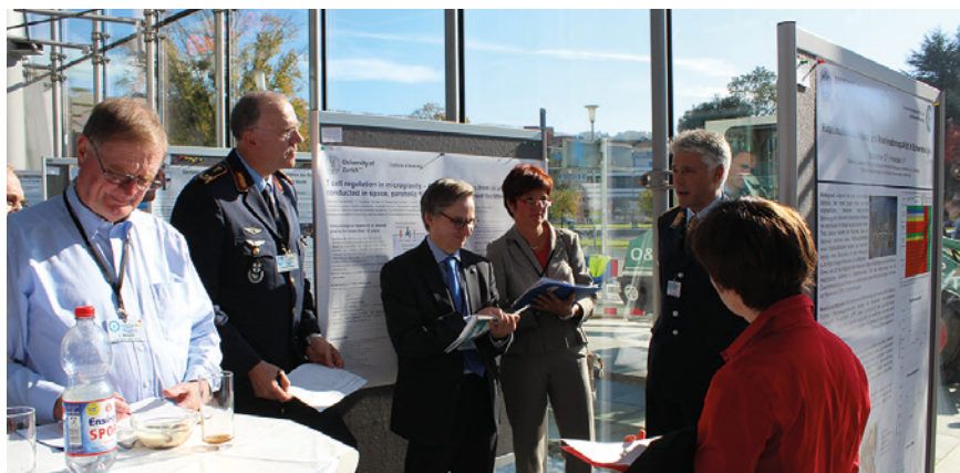
Die Posterkommission bei der Arbeit.