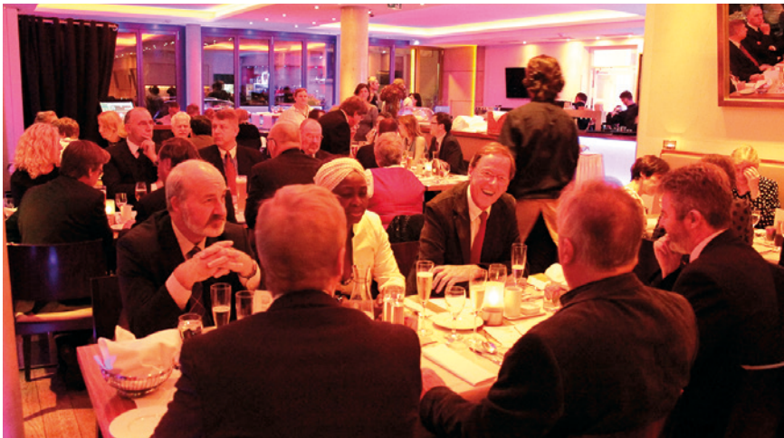
Ausgelassene Stimmung beim Candle-Light-Dinner im Restaurant des Qube Hotels Heidelberg.

An dieser Stelle möchte ich mich ganz herzlich bei allen Kolleginnen und Kollegen bedanken, die mit ihrem Engagement zum Gelingen der Tagung beigetragen haben. Bilder zur Tagung sowie das Gros der Präsentationen können Sie im Mitgliederbereich unserer Homepage www.dglrm.de abrufen.