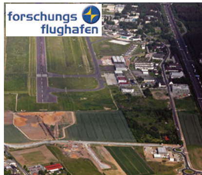
Forschungsflughafen Braunschweig – Ort unserer nächsten DGLRM-Jahrestagung.

Die Zusammenarbeit zwischen ESAM und AsMA soll aber nicht nur auf diesen einen gemeinsamen Kongress beschränkt bleiben. In den Überlegungen von AsMA und ESAM, die Kräfte in der Luft- und Raumfahrtmedizin über die Ländergrenzen hinaus zu bündeln, gibt es Bestrebungen in beiden Gesellschaften zu einer Harmonisierung flugmedizinischer Aus- und Weiterbildung sowie von Ausbildungspunkten und -stunden. Daneben denkt der Vorstand der ESAM darüber nach, wie er die Bemühungen der AsMA, die Anerkennung der Luft- und Raumfahrtmedizin als Spezialdisziplin der Medizin weltweit zu erwirken, unterstützen kann. Die AsMA hat hierzu bereits eine Arbeitsgruppe gegründet. Auch wir sollten uns diesen Entwicklungen nicht ver-