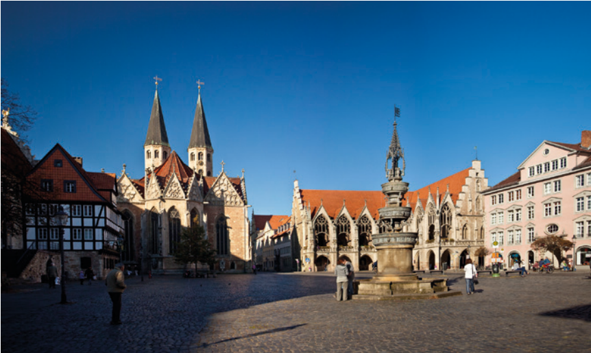
Braunschweig – Blick auf die Altstadt.

auch inhaltlich mehr auf das Gebiet der menschlichen Leistungsfähigkeit (Human Performance) und deren Verbesserung (Enhancement) ausrichten, eine Thematik, die auch hierzulande in der Flugmedizin mehr und mehr an Aktualität gewinnt.