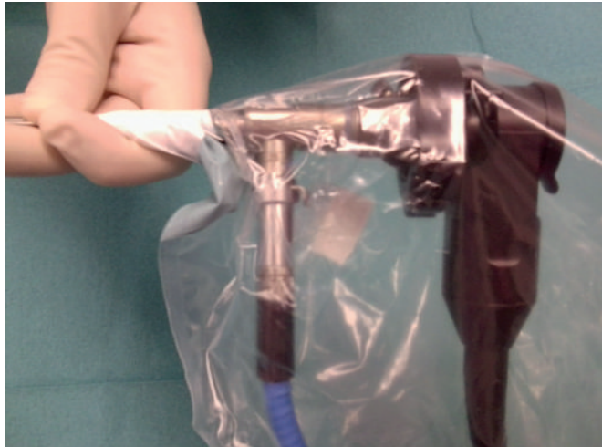
PDD-Kabel im Kamerabezug