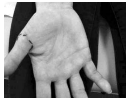
Abb. 1 Volare Hypästhesie der Daumenphalangen distal der eingezeichneten Punkte.

Die Nervensonografie zeigte am proximalen Karpaltunneleingang 3 distinkte Stränge des N. medianus. Nur der radial liegende Strang zeigte in Höhe der Handgelenksfalte am Eintritt in das Retinakulum eine segmentale Verdickung im transversalen und longitudinalen Schnitt-