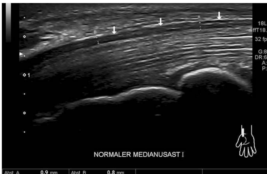
Abb. 4 Ultraschallbild des mittleren Stranges des trifiden N. medianus (Pfeile) im Längsschnitt. Kein Nachweis einer segmentalen Kompression oder Auftreibung.