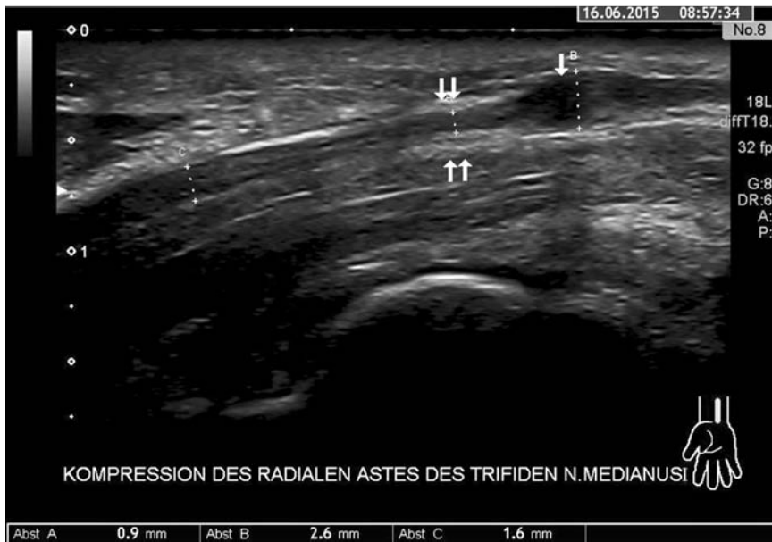
Abb. 3 Ultraschallbild des radial liegenden Stranges des trifiden N. medianus im Längsschnitt. Segmentale Kaliberänderung von 0,9 mm (Messpunkt A) auf 2,6 mm (Messpunkt B). Das Pfeil zeigt die proximal der Kompression liegende Erweiterung des Nervenastes. Die Doppelpfeile zeigen auf die hyperechogene Verdickung des umliegenden Gewebes an der Stelle der Kompression.