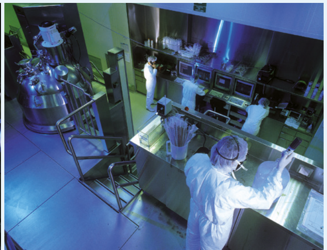
Herstellung von Insulin in der Produktionsanlage von Eli Lilly and Company in Fegersheim / Frankreich.