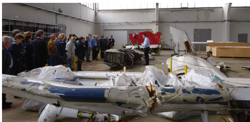
Abb. 3 Teilnehmer der Tagung im Hangar der BFU.

Das Rahmenprogramm gab uns die Möglichkeit auch einen Hauch von der Schönheit der Stadt Braunschweig zu erhaschen. Der Nachtwächter „Hugo“ hat es verstanden, uns die Besonderheiten und