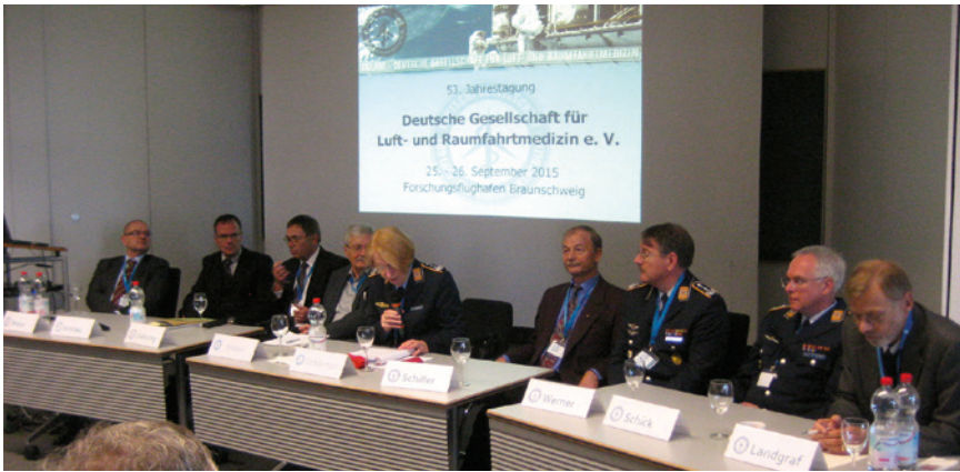
Abb. 4 Podiumsdiskussion am Sonnabendnachmittag.