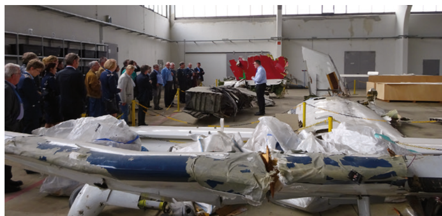
Abb. 3 Teilnehmer der Tagung im Hangar der BFU.

Die letzte Beitragserhöhung wurde im Jahr 2007 beschlossen und, wie damals, müssen wir inzwischen feststellen, dass der derzeitige Beitrag von 100 Euro nicht mehr ausreicht, um eine angemessene wissenschaftliche Arbeit zu leisten und insbesondere unseren Nachwuchs gebührend zu fördern. Auch die wissenschaftliche Jahrestagung leidet regelmäßig unter zu geringen Finanzmitteln und