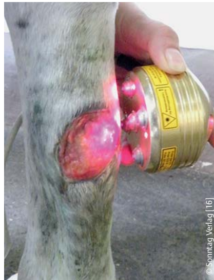
Abb. 2 Therapie der hypergranulierenden Wunde mit einem Flächenlaser (5 × 30 Watt).