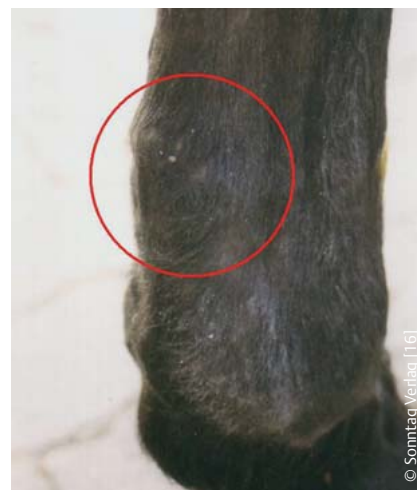
Abb. 5 Sehne zeigt nach insgesamt 5-wöchiger Therapie nochmals eine deutliche Reduktion der Schwellung und Schmerzhaftigkeit. Das Pferd geht lahmfrei.

Auch bei den chronischen Tendinitiden der oberflächlichen Beugesehne ( n = 8 ) und des Fesselträgers ( n = 10 ) war die Therapie sehr erfolgreich. Lediglich ein Patient erlitt ein Rezidiv, als er sich von der Hand losgerissen hatte und in tiefem, sandigen Boden getraut und galoppiert hatte. Ein weiterer Patient erlitt ein Rezidiv nach 18 Monaten Training und Turniersport und wurde euthanasiert. Alle anderen Patienten konnten ohne Einschränkung die gleiche Arbeit wie vor der Verletzung ausführen ohne erneute Probleme zu bekommen. Interessanterweise konnten auch keine Ausfälle durch andere Krankheiten verzeichnet werden. Es ist zu vermuten, dass dies auch auf den Einfluss der Laserakupunktur-Behandlung zurückzuführen ist, da hiermit immer das gesamte Pferd inklusive etwaiger Rückenerkrankungen oder sonstiger Beschwerden therapiert wird und niemals ausschließlich die Sehne. Sehr auffällig war vor allem die sehr viel höhere Anzahl der Behandlungen, die sich zwischen 3 und 36 Behandlungen belief (im Mittel 15,3), die notwendig waren, um der Sehne wieder ihre ursprüngliche Struktur in Festigkeit und Elastizität zu ge-