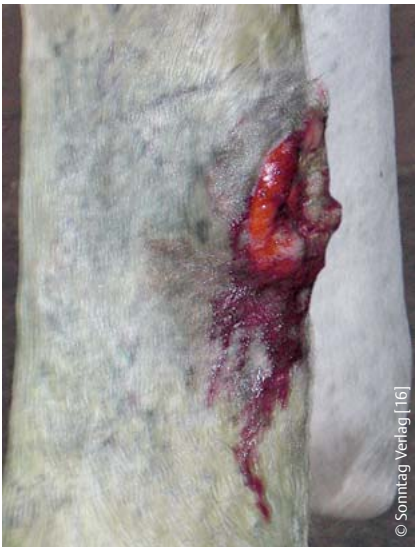
Abb. 1 Infizierte Wunde mit vollständiger Durchtrennung der oberflächlichen Beugesehne.