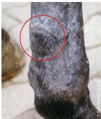
Abb. 4 Sehne nach 5 Behandlungen innerhalb von 14 Tagen. Die stark eiternde Wunde hat sich geschlossen und die Infektion und Schwellung der Sehne hat sich gebessert.

Es wurden insgesamt 30 Pferde in die Studie einbezogen (▶ Tab. 4 ). Bei den Patienten mit akuter Tendinitis ( n = 10 ) der oberflächlichen Beugesehne ( n = 7 ) und des Fesselträgers ( n = 3 ) zeigen sich erwartungsgemäß die besten Resultate. Alle