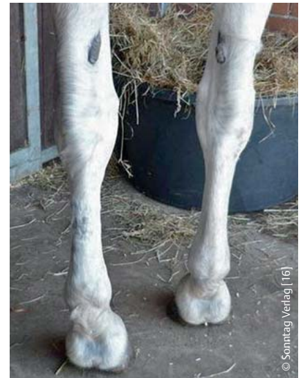
Abb. 3 Vollständig regenerierte Sehne bei Therapieende.

Danach kann man nach sonografischer Kontrolle mit leichter Schrittarbeit unter dem Reiter mit kurzen Trababschnitten beginnen, um in einem Zeitraum von weiteren 4–6 Wochen die Sehne zu ihrer vollständigen Belastbarkeit zu trainieren.