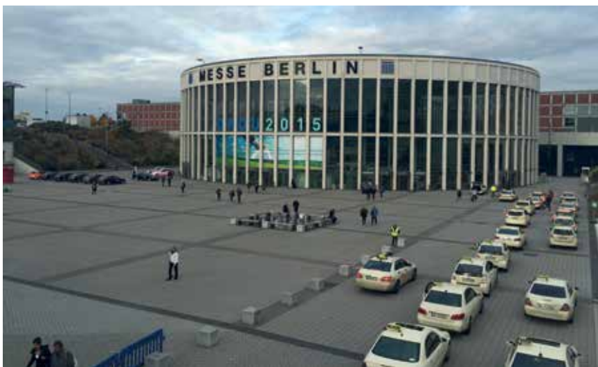
Der größte deutsche Kongress der Orthopädie und Unfallchirurgie zog auch in diesem Jahr zahlreiche Teilnehmer an.