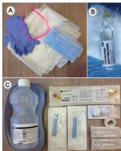
Abb. 1. „Epistaxis-Kit“ Beispiel für die Bereitstellung der Materialien zur Versorgung von Nasenbluten in Klinik und Praxis. A Schutzmateriale für Arzt(a) und Patient (p): Schutzbrille (a), Einmalhandschuhe (a), Einmalkittel und Mundschutz (a+p); B Tranexamsäure und Watte; C2-Ballon-Methode: Choanalballon®, RapidRhino® (5,5 cm und 7,5 cm), Nierenschale, Ampuwa® (Keine NaCl-Lösung!), kleine und große Tupfer, Papierpflaster, 2 Spritzen (10 ml)

praktischen Aspekt „Kontaminationsrisiko für den Arzt“ und „Risikominimierung für den Patienten“ betrachtet. Ferner wurden aktuelle Aspekte im neuen Gerinnungsmanagement in Bezug auf Epistaxisversorgung mit Praxisrelevanz be-