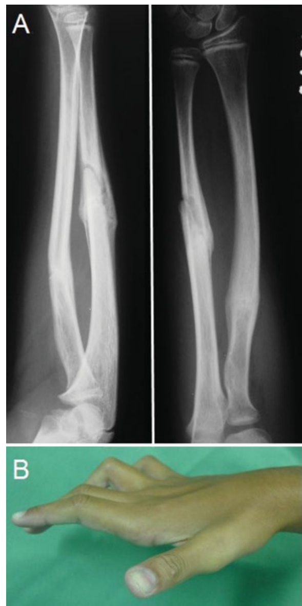
Fig. 1 Paciente de 12 años con fractura cerrada de antebrazo y lesión del nervio cubital. (A) Fractura consolidada sin gran deformidad. (B) En examen físico se observan los signos clínicos de lesión del nervio cubital, con la parestesia y la actitud en garra del cuarto y quinto dedos.

eran positivos. El electromiograma (EMG) demostró una neurotmesis del nervio cubital localizada entre el codo y la muñeca, sin signos de reinervación. Se indicó un tratamiento