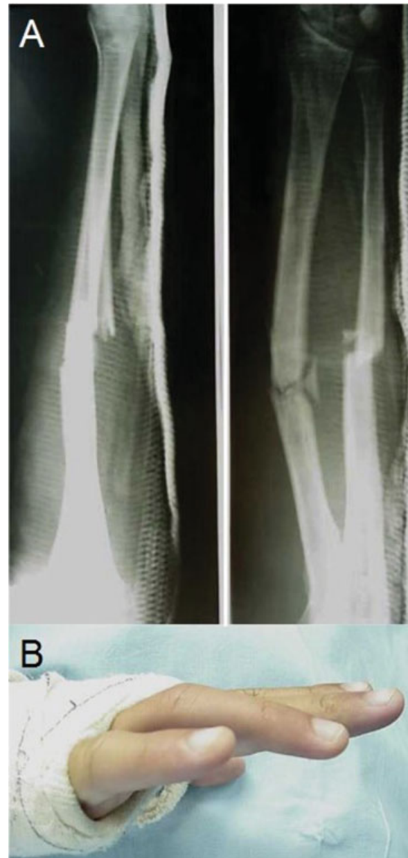
Fig. 3 (A) Imagen radiológica tras la reducción cerrada de la fractura. (B) Tras la reducción, el paciente comienza con clínica de lesión del nervio cubital.

Paciente de 17 años, acude al servicio de urgencias de nuestro hospital tras una caída con monopatín. Presentaba dolor y deformidad en el antebrazo, y limitación funcional del miembro superior. El examen neurovascular en el momento de la urgencia fue normal. Tras realizar el estudio radiográfico, se diagnosticó una fractura desplazada del antebrazo. Se realizó la reducción cerrada de la fractura bajo anestesia intrafocal y, una inmovilización con yeso (►Fig. 3). En el