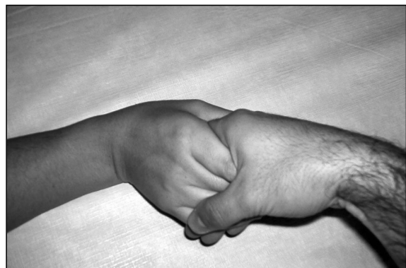
Figura 1. Test de impactación cubital que provoca dolor con la hiperextensión, desviación cubital y compresión axial de la muñeca.

Los pacientes con frecuencia son diagnosticados de esguince de muñeca que no evoluciona satisfactoriamente. Los síntomas incluyen dolor en la cara cubital de la muñeca, frecuentemente con chasquido y aumento del dolor en la pronación y supinación y edema doloroso a la palpación distal a la estiloides cubital. Los síntomas suelen ser mecánicos, mejorando con el reposo y empeorando con la carga axial. Puede haber una disminución de la fuerza de prensión. El test de compresión del CFCT es una maniobra de provocación que resulta en una respuesta dolorosa notoria. Consiste en la realización de una compresión axial, con desviación cubital e hiperextensión (de Araujo, Poehling y Kuzma, 1996) ( Figura 1 ). Debe explorarse la articulación radiocubital distal en busca de inestabilidad. Ésta se pone de manifiesto median-