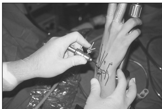
Figura 5. Ver texto.

6U o 6R. Posteriormente se distiende la articulación radiocarpiana con 10 cc de suero salino y a continuación se hace una incisión de 4-5 mm con bisturí en el lugar de los portales a utilizar. Después se realiza una disección roma y se introduce el trócar y la vaina del artroscopio y el artroscopio en el portal 3-4 ( Figura 5 ). A través del portal 6R introducimos un gancho palpador para verificar la integridad del CFCT, mediante la confirmación del «efecto trampolín» o sensación de rebote elástico bajo el palpador presente en los CFCT indemnes,