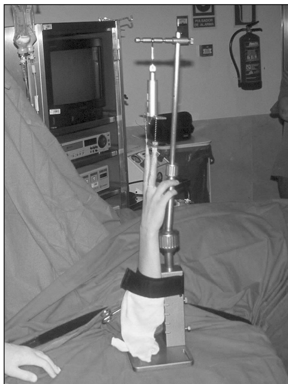
Figura 4. Miembro superior colocado, con los dediles en 2º y 3º dedos, en la torre de tracción de artroscopia.

La técnica se realiza con el paciente en decúbito supino y bajo anestesia general o con bloqueo axilar. Se ajusta el manguito de isquemia en el brazo y posteriormente se coloca el miembro superior en una torre de tracción para artroscopia, con dediles dispuestos en los dedos 2º y 3º ( Figura 4 ). Se aplica una tracción de 14 libras. Con un lápiz dermatográfico se dibujan todas las referencias anatómicas, incluyendo el tubérculo de Lister, los tendones extensores, la estiloides del cúbito y el cubital posterior. Estas referencias nos ayudan a localizar los portales artroscópicos. Una vez hecho esto, se introduce una aguja intramuscular a nivel del portal 3-4 con una inclinación de 15º de distal a proximal y otra a nivel del portal