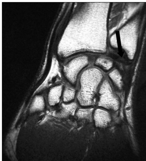
Figura 2. Corte coronal de RMN en el que se muestra una rotura en su inserción cubital (flecha).

te el «signo de la tecla de piano» si la cabeza del cúbito se mueve libremente en el plano dorso-palmar.