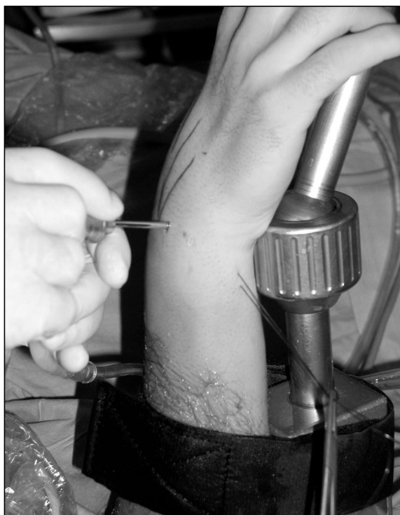
Figura 6a. Ver texto.

y el terminal motorizado para realizar una resección de la sinovial si es preciso. Una vez localizada la desinserción periférica del CFCT, se introduce una aguja para uso epidural de 18-20 G de punta roma, a través del portal 6R. Esta aguja se pasa a través del borde libre del desgarró del CFCT, y se saca por la piel palmar de la parte cubital del carpo, siempre teniendo en cuenta el trayecto del nervio cubital y de su rama sensitiva dorsal, que separamos hacia medial traccionando del FCU. Posteriormente enhebramos a través del orificio distal de la aguja, un PDS de 2-0, retiramos la aguja de su inserción en el CFCT y volvemos a introducirla en el CFCT en un punto situado a una distancia de 4-5 mm de la primera localización. Sacamos la aguja nuevamente a través de la piel palmar de la parte cubital del carpo, traccionamos del hilo para sacarlo completamente a través de la aguja y anudamos en la piel con un punto de colchonero horizontal apoyado en una gasa ( Figura 6 ). A continuación los pacientes son inmovilizados con una férula posterior o con un yeso braquiopalmar en supinación durante 4 a 6 semanas. Una vez retirada la inmovilización se inicia un programa de tratamiento rehabilitador.