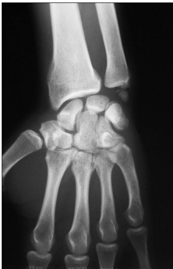
Figura 3. Paciente que sufrió traumatismo deportivo con fractura de la extremidad distal de radio y de la apófisis estiloides cubital. Esta fractura fue tratada ortopédicamente y evolucionó hacia la pseudoartrosis de la estiloides cubital.

tes 4 pacientes que no tenían estudio de imagen complementario, se llegó al diagnóstico mediante artroscopia diagnóstica.