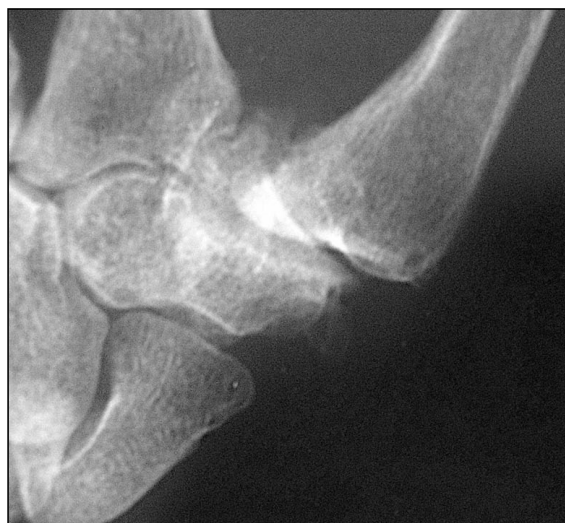
Figura 1: Aspecto radiográfico de ATM estadio III Eaton y Glickel.

La valoración preoperatoria se realizó mediante un protocolo donde se incluían los datos del paciente, edad, sexo, lado, dolor, movilidad y fuerza. La edad media fue de 62 años (50-75) y se intervino sobre la mano dominante en 20 casos. El sexo predominante fue el femenino con un 82%. En todos los pacientes se descartaron patologías coexistentes como síndrome de túnel carpiano, tenosinovitis De Quervain, inestabilidad rotacional del escafoides o cambios degenerativos radioescafoideos.