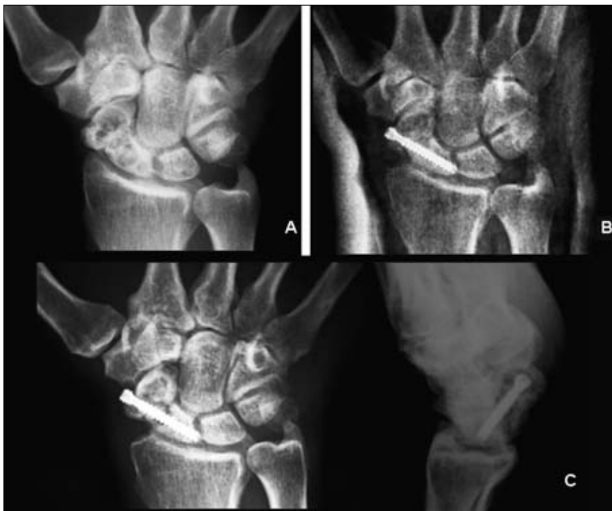
Figura 1: Varón de 38 años que consulta por dolor a nivel de tabaquera anatómica. Antecedente traumático hace meses sin tratamiento inicial. A: Rx AP inicial. B: reducción abierta y osteosíntesis con tornillo de compresión (BOLD R , Osteosan). C: Rx 7 meses después de la cirugía donde no se observa consolidación de la fractura.

óseas por el foco de fractura, en el 13,3% la consolidación se diagnosticó por TAC, ante imágenes no concluyentes en las radiografías en un plazo medio de 12 semanas (rango 6-16), y un caso (6,6%) no consolidó.