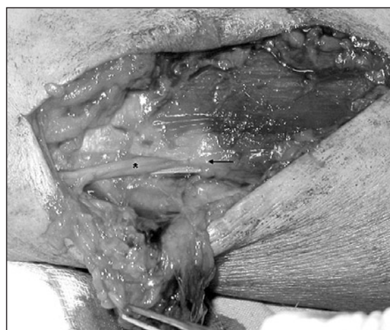
Figura 3. Se extirpa tumoración. Se aprecia la salida del nervio radial entre dos bandas tendinosas del brachioradialis (marcado con una flecha).