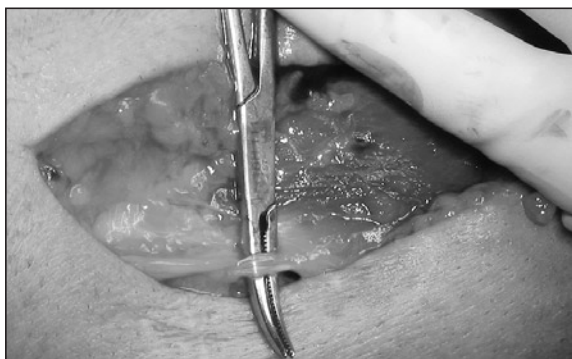
Figura 4. Banda dorsal del brachioradialis que comprime rama sensitiva del nervio radial.

una compresión del mismo entre dos bandas tendinosas del brachioradialis, en el punto donde la rama sensitiva radial emerge hacia la superficie ( Figura 4 ). Se resecó la banda tendinosa más dorsal, quedando libre el nervio ( Figura 5 ). La anatomía patológica nos confirmó el diagnóstico de hemangioendotelioma. El paciente mejoró significativamente de la sensación parestésica.