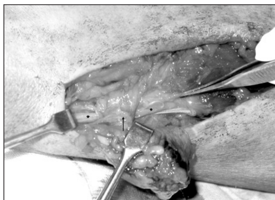
Figura 2. Se aprecia cómo, distal a su salida a través del brachioradialis, la rama sensitiva del nervio radial (*) está rodeada de la tumoración (marcada con una flecha).