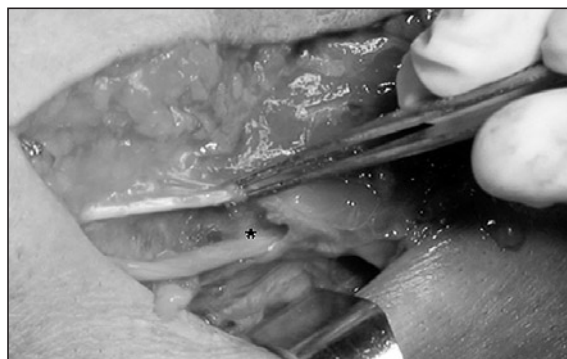
Figura 5. Rama sensitiva del nervio radial (*) libre tras tenotomía de la banda dorsal del brachioradialis.

El síndrome de Wartenberg es inicialmente descrito como una neuritis de la rama sensitiva del radial 1,3 . Lanzetta y Foucher 2 diferencian 3 grupos de pacientes a la hora de diagnosticar el síndrome de Wartenberg, en función del lugar donde sea positivo el signo de Tinel: si éste se presenta a la altura de la estiloides radial o alrededor del primer compartimento extensor, habrá que buscar factores de compresión externa (reloj, yeso, cicatrices, gangliones, etc.); si el Tinel es a unos 8 cm de la estiloides, la causa está en la zona donde el nervio pasa de un plano profundo submuscular a un plano superficial subcutáneo, atravesando la fascia que envuelve el brachioradialis y el extensor carpi