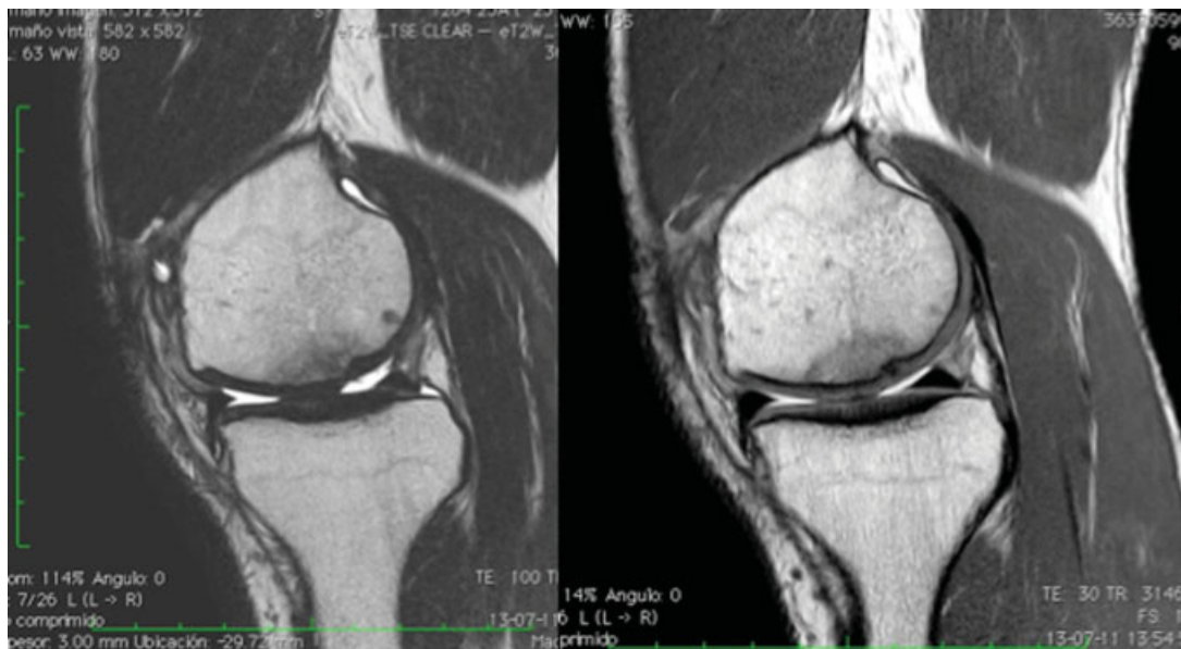
Fig. 3 Imagen de control de 2 años posterior a la cirugía. Se evidencia irregularidad en zona posterior, pero cubierto por tejido de intensidad similar al cartílago.

rodilla. Las técnicas actuales disponibles para tratar esas lesiones incluyen la micro/nano fractura, el transplante osteocondral autólogo, la mosaicoplastía, la implantación autóloga de condrocitos (ACI/MACI) y el uso de diferentes matrices . 3,7 Actualmente, las investigaciones en ciencias básicas han adicionado al arsenal terapéutico el uso de