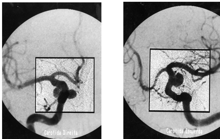
Figura 3 – Angiografia mostrando aneurismas da artéria carótida interna esquerda no segmento comunicante posterior e da artéria carótida interna direita nos segmentos comunicante posterior e hipofisária superior.