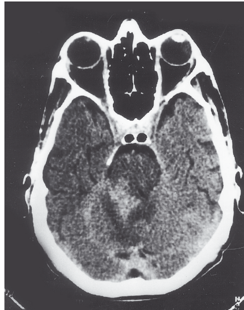
Figura 3 – TC demonstrando redução significativa do hematoma no hemisfério cerebelar direito.

Foi submetido a tratamento com analgésicos, antieméticos, diurético osmótico e repouso no leito. Após 5 dias, foi submetido à nova TC de crânio que demonstrou redução do hematoma. Após 12 dias de internação, nova TC apresentou resolução parcial do hematoma (Figura 3). Recebeu alta médica hospitalar após 21 dias de observação e tratamento clínico, com disartria e leve ataxia da marcha. Foi encaminhado para ambulatório de fonoaudiologia e fisioterapia para tratamento complementar. Foi submetido a exame de angiografia cerebral dos quatro vasos que afastou a possibilidade de hemorragia por aneurisma ou má-formação arteriovenosa.