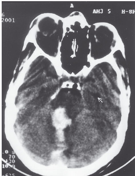
Figura 1 – TC apresentando extenso hematoma no hemisfério cerebelar direito.

varam-se fratura occipital direita e hematoma intraparenquimatoso no hemisfério cerebelar direito com compressão do tronco cerebral; ventrículos de tamanhos normais e simétricos (Figura 1). A ressonância magnética (RM) revelou lesão hiperdensa no hemisfério cerebelar direito com compressão do tronco cerebral (Figura 2).