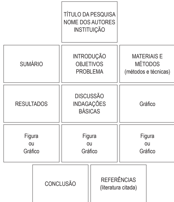
Figura 1 – Painel artesanal (1 m 2 ).

Se houver alguma dúvida sobre a ordem em que o texto deve ser lido, guie o leitor, numerando o texto claramente ou ligando-o com setas. O fluxo da informação deverá ser lido seguindo a seqüência da esquerda para a direita e do alto para baixo 1 .