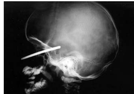
Figura 1 – Radiografias pré-operatórias de crânio.