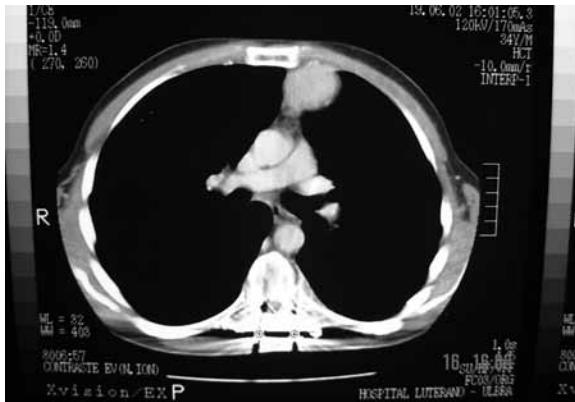
Figura 5 – TC de tórax com presença de sementeira tumoral retroesternal.

Após um ano, retornou ao hospital com deformidade torácica e acentuada cifose devida à falência da artrodese posterior, sendo submetido à cirurgia para correção pela via posterior. Durante esse ato cirúrgico, foi reconhecida recidiva tumoral no enxerto de costela posterolateral esquerdo, sendo feita exérese, preenchimento com cimento acrílico e artrodese com ganchos sublaminares acima e parafusos pediculares abaixo da lesão.