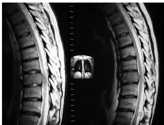
Figura 2-B – RM em corte sagital da coluna torácica evidenciando processo expansivo com lesão lítica do corpo e pedículo esquerdo da nona vértebra torácica apresentando invasão do canal e compressão medular.