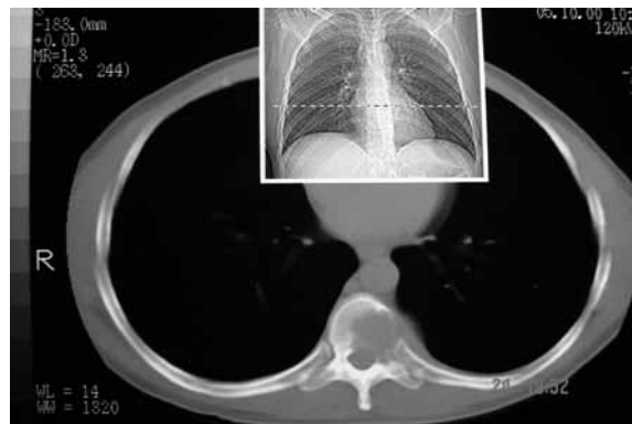
Figura 1 – TC de tórax não focada na coluna vertebral evidenciando processo expansivo com lesão lítica do corpo e pedículo esquerdo da nona vértebra torácica.

Chegou ao serviço com dor no rebordo costal esquerdo, de natureza radicular e com padrão dermatômico. Realizou ressonância magnética (RM) da coluna torácica, que confirmou o achado tomográfico, além de invasão do canal e certa compressão medular (Figuras 2-A e 2-B). Punção biópsia guiada por TC sugeriu diagnóstico presuntivo de cisto ósseo aneurismático, havendo possibilidade alternativa de TCG, raro em vértebras, não podendo, porém, ser afastada. Angiografia espinal mostrou “blush patológico” em T10 à direita.