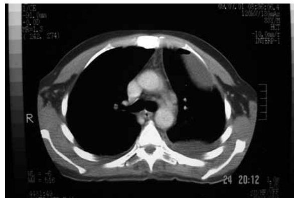
Figura 4 – TC de tórax evidenciando empiemas múltiplos.