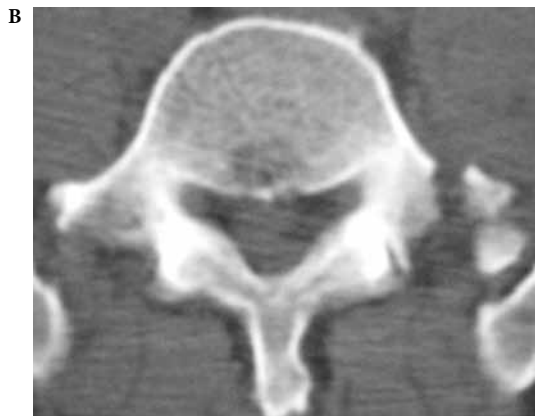
Figuras 1A e 1B – TC de coluna lombar apresentando fratura do processo transverso esquerdo de L5.