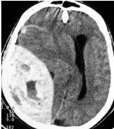
Figura 3 – TC de crânio sem contraste com volumoso hematoma epidural parietal direito, desvio das estruturas da linha média, densidade mista e presença do sinal do redemoinho.