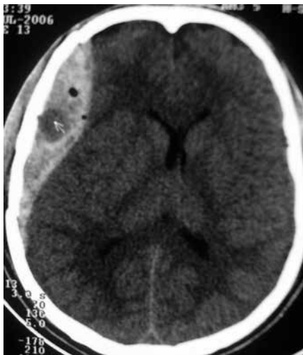
Figura 4 – TC de crânio sem contraste apresentando hematoma extradural parietal direito, efeito de massa e com dupla densidade, caracterizando o sinal do redemoinho.

A densidade do hematoma na TC depende do hematócrito, do conteúdo de proteína existente na hemoglobina, além de uma pequena participação das concentrações de protoporfirina e cálcio. O componente ferro participa com 7% a 8% da densidade do hematoma. 5 Assim, a aparência da hemorragia na TC varia dependendo do conteúdo sanguíneo. Em pacientes com perfil hematológico normal, ela é tipicamente hiperdensa na sua fase aguda, por causa do acúmulo de sangue coagulado. Em casos de pacientes portadores de coagulopatias, como deficiência de fatores da coagulação, e em caso em que o hematócrito seja abaixo de 23% ou em que a concentração de hemoglobina seja inferior a 8 g/dl, o hematoma se mostra isodenso em relação ao parênquima cerebral.