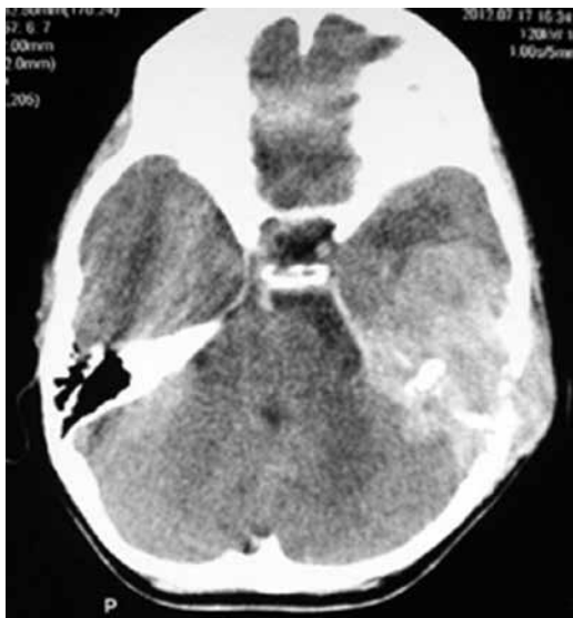
Figura 1 - TC de crânio pré-operatória em corte axial demonstrando lesão expansiva hipercaptante em osso petroso esquerdo.