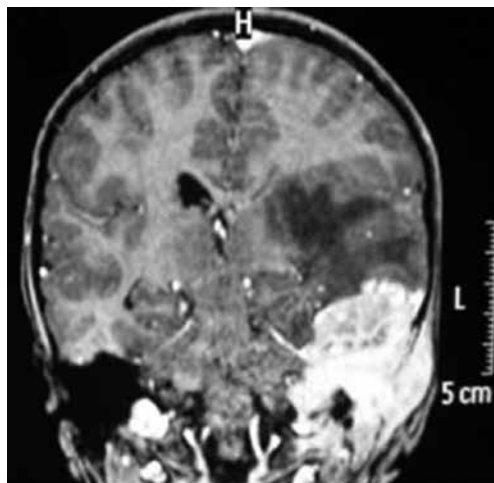
Figura 3 - RM de encéfalo T1 contrastada em corte coronal da referida lesão.