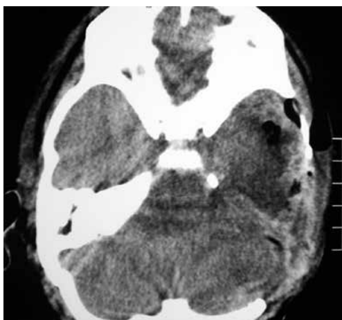
Figura 4 - TC de crânio contrastada após tratamento neurocirúrgico com ressecção total da lesão.

Anatomopatológico e exame imunoistoquímico compatíveis com adenocarcinoma glandular focal (Figura 5). Encaminhado para terapia oncológica com quimioterapia e radioterapia. Óbito após quatro meses do tratamento neurocirúrgico.