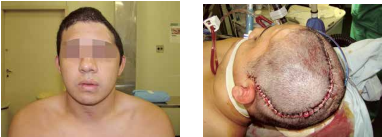
Figura 3 - Imagens pré- e pós-operatória da cranioplastia realizada.