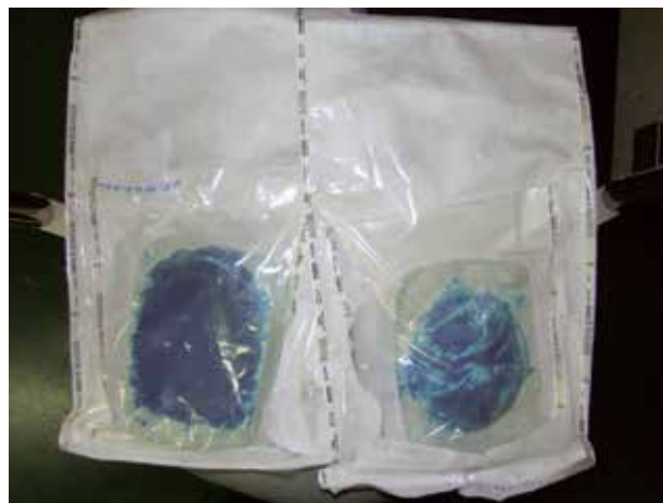
Figura 1 – Molde já esterilizado em sterrad .

O resultado estético é muito bom conforme figuras 3 e 4.