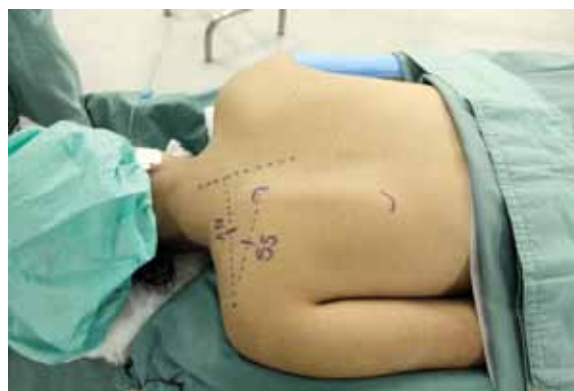
Figura 1 – Paciente em decúbito ventral para a realização da abordagem posterior. A linha superior traçada entre a linha média da coluna e o acrômio mostra a posição do nervo acessório (AN). A linha inferior representa a escápula e o nervo supraescapular (SS).

Via posterior: O paciente é posicionado em decúbito ventral. São feitas as marcações de pontos de referência na pele para a localização dos nervos (Figura 1). Para identificação do nervo acessório, traça-se uma linha ao longo da borda superior da escápula, entre o processo espinhoso e o acrômio, e marca-se o ponto do nervo cerca de 40% da distância partindo-se da linha média. O músculo trapézio é aberto na direção das suas fibras e utiliza-se o estimulador de nervo que auxilia na sua posição. Para a localização do nervo supraescapular, o ângulo superior da escápula e o acrômio são marcados; no ponto médio entre estas duas referências encontra-se o nervo supraescapular. Após a incisão, o músculo trapézio é aberto para em seguida realizar a palpação da borda superior da escápula e localizar a incisura escapular onde se encontra o nervo. Após a abertura do ligamento, o nervo supraescapular está liberado para receber o nervo acessório que é rebatido em sua direção. A sutura é feita com fio 9-0 e utilizando o microscópio cirúrgico (Figura 2).