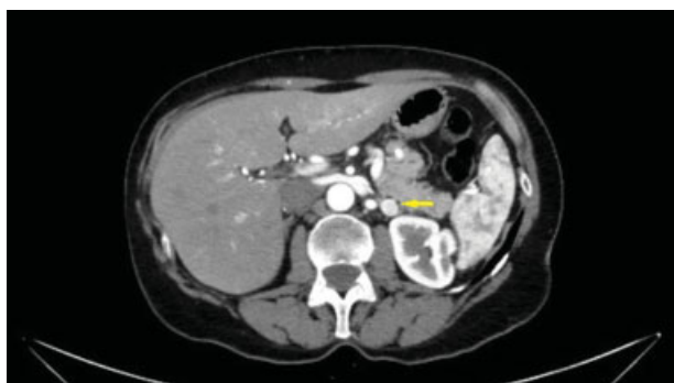
Fig. 2 Nódulo suprarrenal izquierdo de nueva aparición de 12 mm sospechoso de metástasis (flecha).

El CR es cada vez más frecuentemente diagnosticado de forma incidental, lo que conlleva a detectarlo con menores tamaños y en estadios asintomáticos. La triada clásica de dolor en el flanco, hematuria y masa palpable sólo aparece en el 6%–10%. El tratamiento actual recomendado en el CR localizado es la cirugía resectiva. En estadios T1a y T1b se