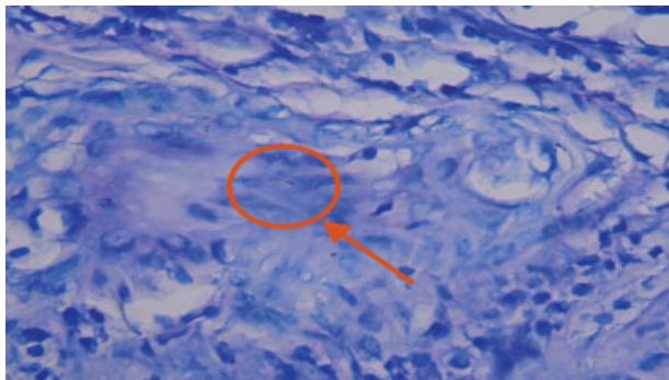
Fig. 2 Bacilos ácido alcohol resistentes (BAAR) según coloración de ZN del estudio citopatológico de testículo derecho.

color blanquecino, de consistencia firme, que ocupaban el 50% de la superficie y ubicados a un centímetro de la túnica vaginal. Parénquima testicular con histoarquitectura distorsionada por la presencia de un proceso inflamatorio crónico severo constituido por linfocitos, plasmocitos y células gigantes multinucleadas, formando granulomas con necrosis central extensa. Se observaron tubos seminíferos,