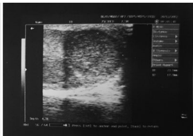
Fig. 3 Ecografía testicular. El testículo izquierdo mide 67 \times 24 mm.