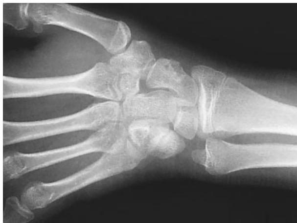
Fig. 1 Rx en la que se puede observar lesión en borde radial de escafoides.