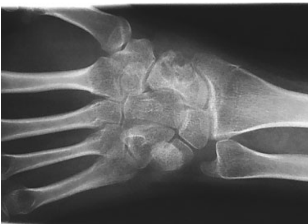
Fig. 5 Se observa la recidiva del tumor en el sitio original.

cirugía, el paciente no ha presentado recidivas y se encuentra asintomático.