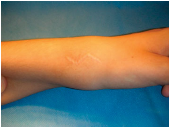
Fig. 4 Tumefacción sobre el aspecto radial de la muñeca.