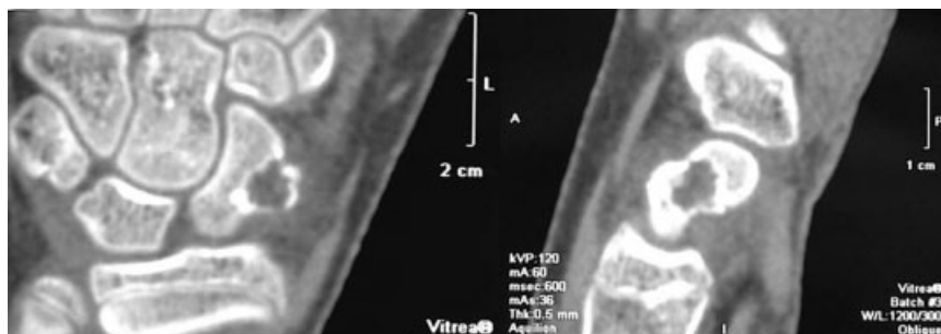
Fig. 3 TAC, se observa lesión con invasión del borde radial del escafoides.