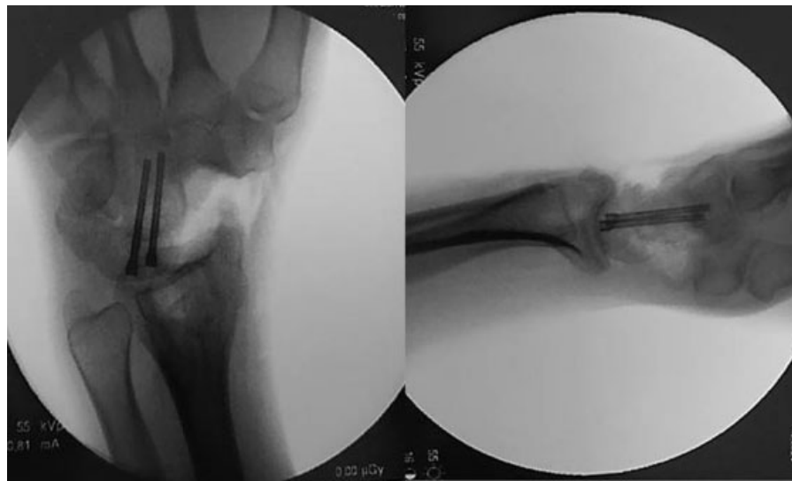
Fig. 8 Imagen intraoperatoria de artrodesis semilunar-grande con exéresis completa de escafoides.

la exéresis del tumor original. 15,17 También es cierto que en muchos de los casos publicados por la aparición de metástasis, el tumor primario se hallaba en el esqueleto axial (costilla, 17 pelvis, 20,21 columna, 19 aunque también alguno originalmente diagnosticado en astrágalo. 18 Las metástasis pueden también ser diagnosticadas a la vez que el tumor óseo. 14,18,19,25 La anatomía patológica de las metástasis era superponible al tumor primario con variación aneuploide. 14,19