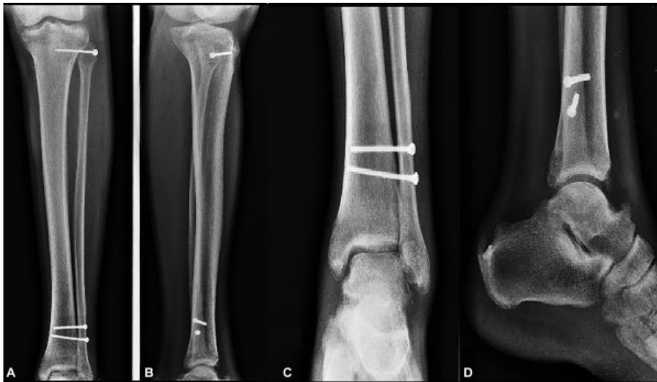
Fig. 3 Radiografia anteroposterior (A) e de perfil (B) da perna e anteroposterior (C) e de perfil (D) do tornozelo pós-cirurgia.