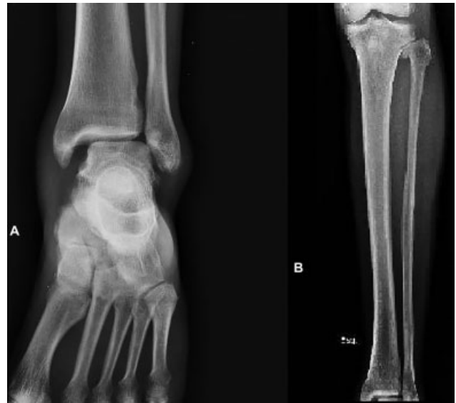
Fig. 1 Radiografias anteroposterior do tornozelo (A) e da perna (B) evidenciando disjunção da sindesmose do tornozelo e subluxação tibiofibular proximal, respectivamente.

O paciente do estudo foi submetido a redução anatômica cirúrgica sob raquianestesia. Utilizou-se o acesso lateral curvilíneo ao joelho iniciando no côndilo lateral do fêmur em direção à borda anterior da porção proximal da fíbula. O nervo fibular comum foi identificado e afastado delicadamente. A articulação tibiofibular foi identificada e o hematoma da lesão foi drenado, realizando-se a redução e fixação. A lesão no tornozelo foi tratada percutaneamente, tomando-se o cuidado da manutenção da divergência entre os parafusos. Nesta abordagem, foram utilizados dois parafusos corticais Orthosir (Medtronic®, Dublin, Irlanda) de 3.5mm em titânio no tornozelo e um parafuso cortical Orthosir em titânio na articulação tibiofibular proximal após a redução anatômica por visualização direta (►Fig. 3). Foi obtida a redução anatômica e perfeita estabilidade, preservando o arco de movimento funcional do tornozelo e do joelho, bem como o alinhamento e a rotação.