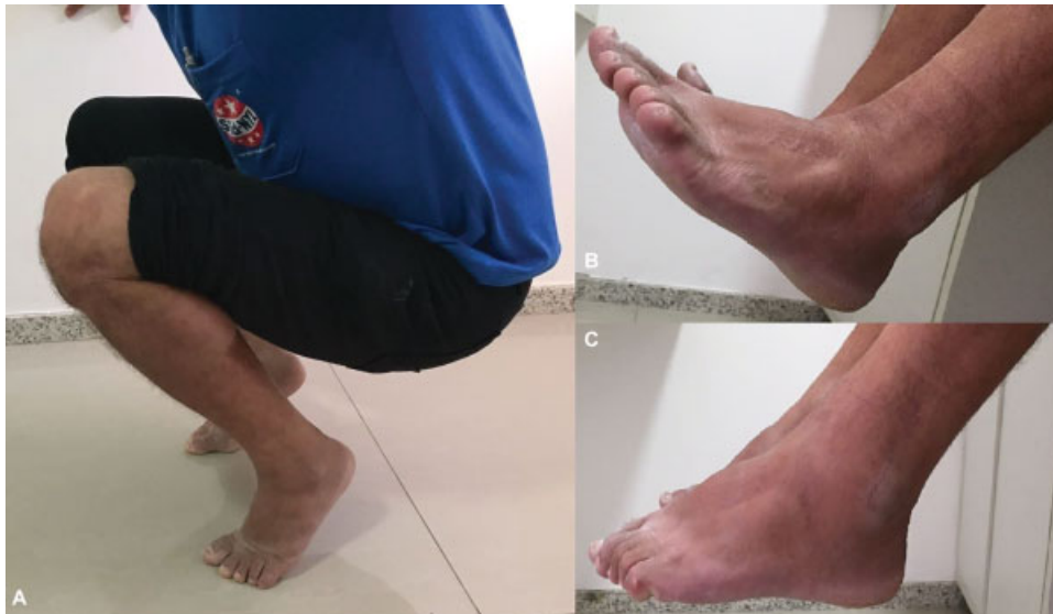
Fig. 4 Arcos de movimentos totais de joelho e tornozelo (A); Dorsiflexão total (B); Flexão plantar total (C).

fíbula é muito raro e pouco descrito na literatura. Há quatro possibilidades deste deslocamento: anterolateral (mais frequente), posteromedial, superior, e subluxação atraumática. 5