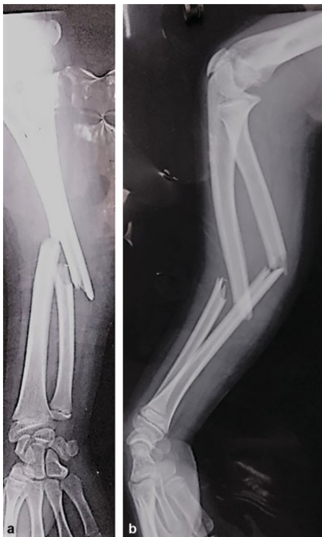
Fig. 1 (a) Visão anteroposterior (AP) e (b) visão lateral de um menino de 10 anos que sofreu fratura do antebraço do lado direito.