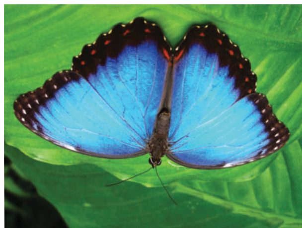
Fig. 2 Imagen de una mariposa.

Los autores declaran que no existen conflictos de intereses.