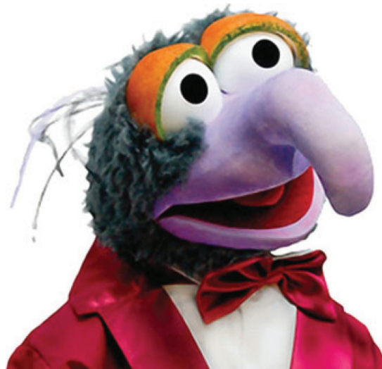
Figura 2 Imagen del querido y excéntrico Gonzo, de los Muppets.

received January 21, 2020 accepted February 7, 2020 published online April 22, 2020