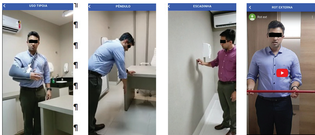
Fig. 1 Orientações para execução dos exercícios.

O trabalho consistiu na aplicação de um questionário para avaliação da percepção dos pacientes sobre a criação de um aplicativo que os oriente no pós-operatório em cirurgias realizadas no ombro. O questionário continha questões sobre a facilidade em se realizar o download , facilidade para o entendimento dos exercícios, possível indicação do aplicativo, posicionamento sobre a participação do paciente com relação ao tratamento da doença e se o indivíduo considerou o programa autoexplicativo.