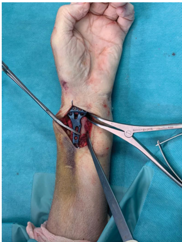
Fig. 2 Aplicación del distractor en el foco de fractura para restaurar la relación radio-cubital en fracturas con acortamiento severo.

Finalmente, se completó la fijación con tornillos de estabilidad angular, comprobación escópica definitiva y cierre por planos.