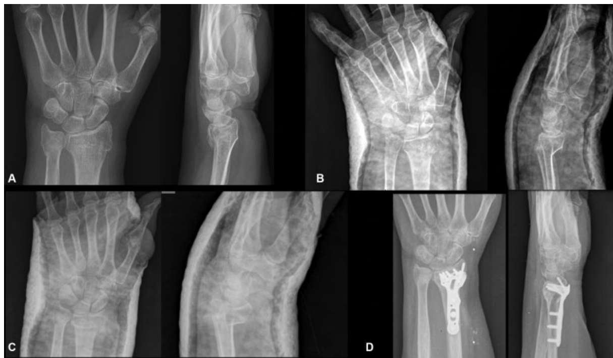
Fig. 1 Ejemplo de fractura de radio y cubito distal inestable. (A) Fractura inicial. (B) Reducción cerrada. (C). Empeoramiento de los parámetros radiológicos a las 3 semanas de evolución. (D) Tratamiento definitivo.

mano. Se realizó una valoración preoperatoria con recogida sociodemográficos, antecedentes médicos relevantes, comorbilidades y grado de autonomía. Se realizó una valoración seriada del estudio radiológico de la fractura inicial, reducción (realizada en los servicios de urgencias), postoperatorio y al final de seguimiento. Como clasificación de la fractura se utilizó la propuesta por Fernández. 3 Se realizó la medición preoperatoria y postoperatoria de la inclinación radial, báscula volar, varianza cubital y gap articular. El análisis radiológico consistió en la comparación con los valores de normalidad descritos en la literatura. 4 Para la valoración del resultado funcional se aplicó el Mayo Wrist Score 5 al final del seguimiento. A nivel de técnica quirúrgica se analizó la realización de artroscopia, la utilización de injerto óseo y el tratamiento de fracturas asociadas en el cúbito. Por último, se realizó una valoración de las complicaciones postoperatorias.