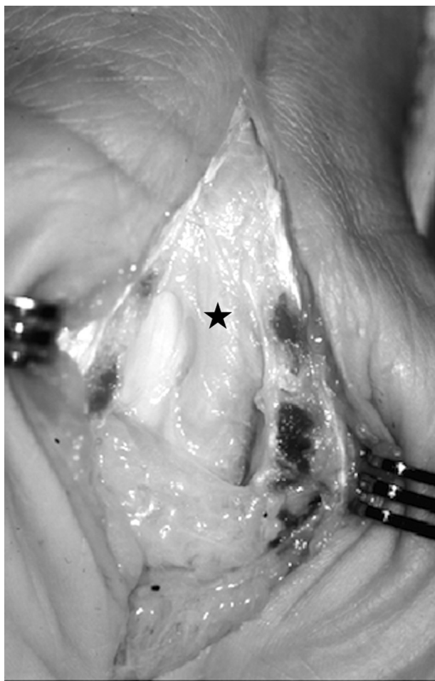
Fig. 2 Incisão ampla para permitir identificação de potenciais locais remanescentes de compressão e de aderências em torno do nervo mediano (estrela).

Procedimentos coadjuvantes muitas vezes são necessários para restaurar o deslizamento do nervo mediano, minimizar