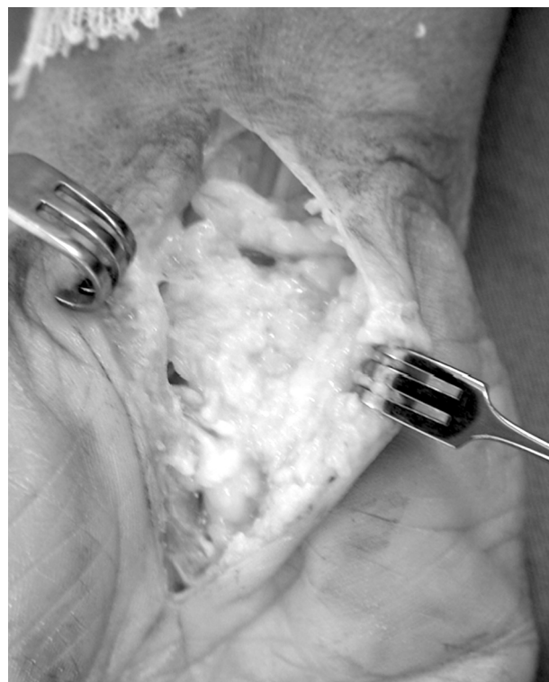
Fig. 3 Um retalho de tecido adiposo da eminência hipotenar foi realizado para interpor tecido adiposo entre o nervo mediano e o ligamento transverso do carpo transversal e a cicatriz cirúrgica.

Diferentes retalhos tem sido descritos para proteger o nervo mediano e melhorar a circulação local. O retalho adiposo da eminência hipotenar foi popularizado por Strickland 51 (►Fig. 3). Após a descompressão do nervo mediano e