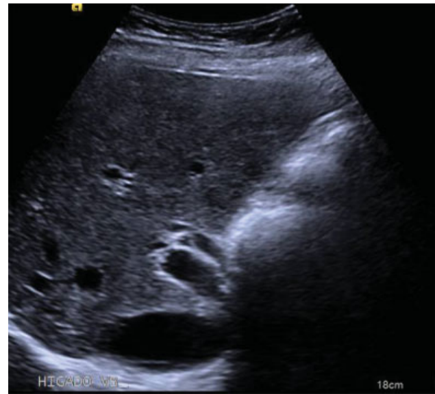
Fig. 2 Vía biliar de calibre normal.

Los hallazgos clásicamente descritos no difieren de lo observado en nuestro caso: una vesícula única, de tamaño