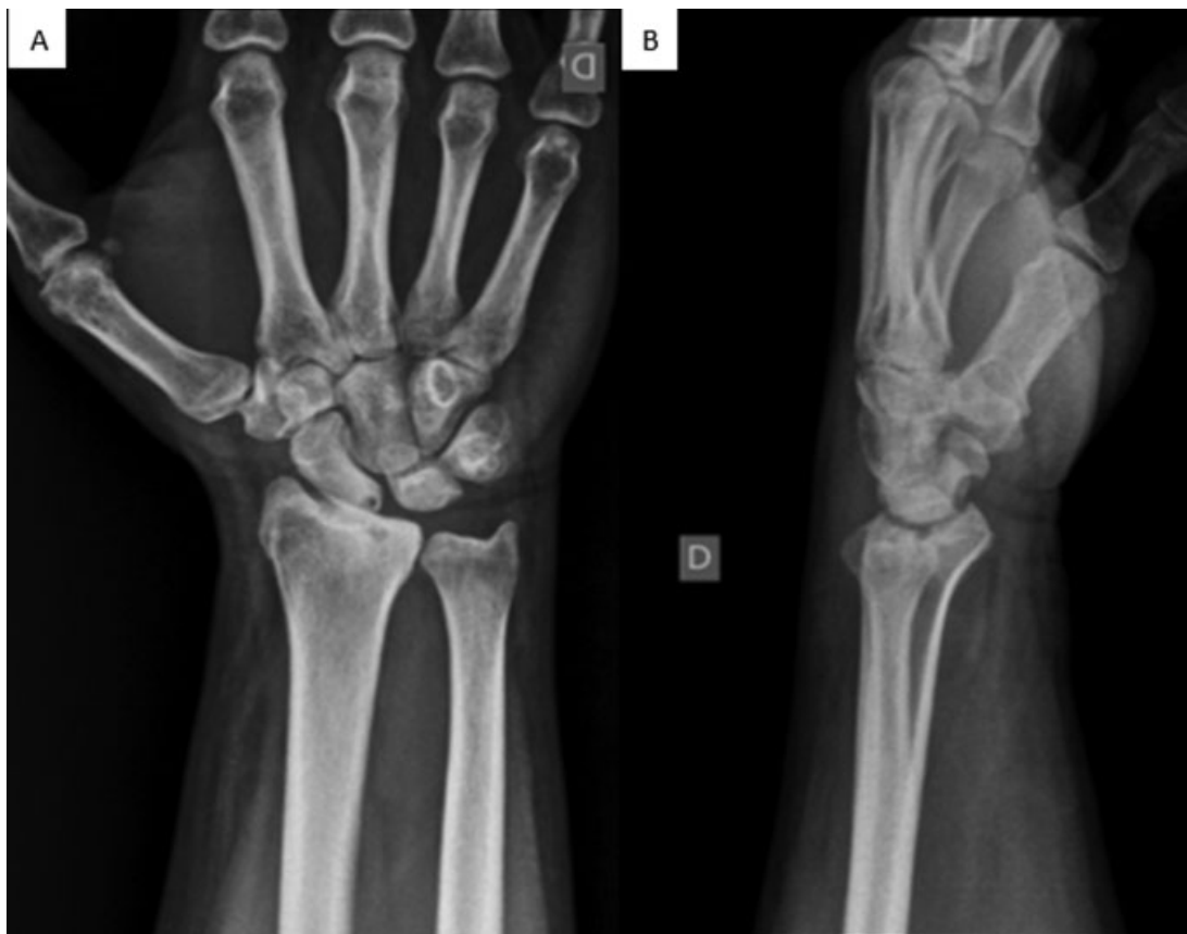
Fig. 3 Radiografias em posteroanterior (A) e perfil (B) da porção distal do rádio direito, consolidação viciosa com degrau articular radiocarpal e perda da inclinação volar normal do rádio.