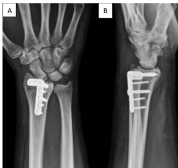
Fig. 5 Radiografia pós-operatória com 4 semanas de evolução, posteroanterior (A) e perfil (B). Redução do degrau articular e do alargamento da superfície articular do rádio, conforme realizado no planejamento pós-operatório em modelo PLA.

Caso 2—Paciente masculino, 47 anos de idade, pós-tratamento não cirúrgico de fratura da porção distal do rádio direito ocorrida há 4 meses. Nas radiografias do punho, evidencia-se consolidação viciosa com perda da inclinação volar e alargamento da superfície articular do rádio distal com degrau articular radiocarpal (► Figura 3 ). De forma semelhante ao caso anterior, imprimiu-se modelo em ácido polilático de ambos os raios distais do paciente, onde foi esquematizado o ponto de osteotomia e correção da deformidade (► Figuras 4 e 5 ).