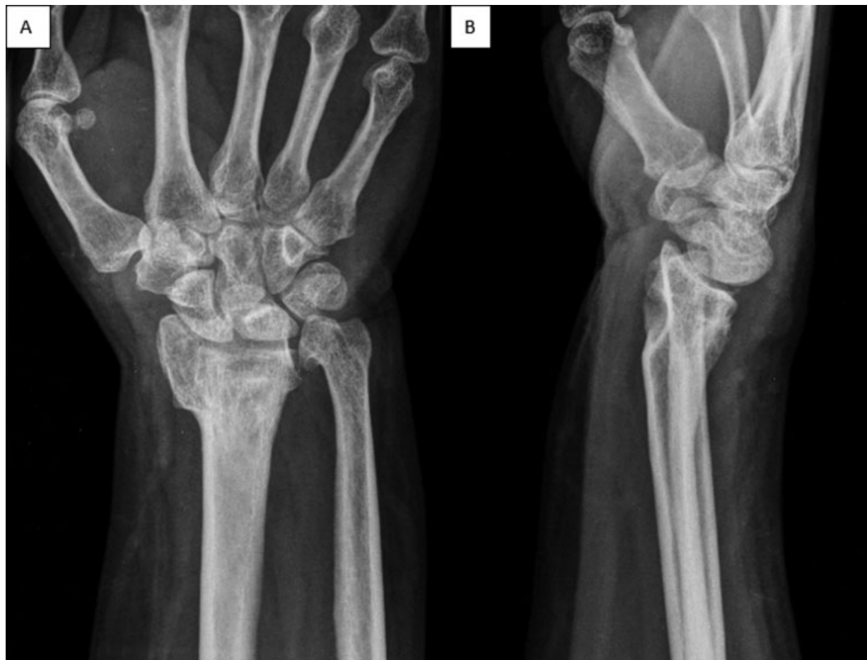
Fig. 1 Radiografia posteroanterior (A) e perfil absoluto (B) do punho esquerdo demonstrando consolidação viciosa com desvio dorsal, encurtamento do rádio e seqüela com deformidade da cabeça da ulna, associado a instabilidade cárpica adaptativa.

Caso 1 - Paciente feminina, 46 anos de idade, seqüela de fratura da porção distal do rádio esquerdo há 4 anos, tratada na ocasião com imobilização gessada, evoluiu com quadro de dor e limitação de flexão do punho esquerdo. Radiografia posteroanterior e perfil absoluto do punho esquerdo demonstrando consolidação viciosa (► Figura 1 ). Prototipagem a partir da tomografia computadorizada com reconstrução 3D do rádio distal bilateral permitiu o melhor entendimento da deformidade e planejamento cirúrgico (► Figura 2 ).