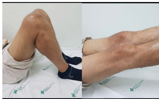
Fig. 2 Lesão do tendão quadricepsal do joelho esquerdo e sutura término-terminal do tendão do quadríceps.

desinserção completa do tendão do quadríceps na região proximal da rótula. Após a retirada do hematoma, foi realizado reparo do coto proximal ao polo superior da rótula com a técnica de Krackow, 6 utilizando fios inabsorvíveis número 2 (Ethibond, Medline Industries, Inc., Northfield, IL, EUA). Também foram utilizadas 2 âncoras de 5 mm no polo superior da patela, realizando-se dessa forma a reinserção tendinosa, com o joelho em 40° de flexão. A lesão do joelho esquerdo foi abordada com incisão semelhante, sendo observada uma lesão completa na junção miotendinosa do tendão do quadríceps e realizada a sutura término-terminal pela técnica de Krackow, 6 utilizando fios Ethibond número 2, com o joelho em 40° de flexão (► Fig. 2 ). Em ambos, os joelhos as lesões retinaculares foram reparadas com Vycril 2.0 (Ethicon, Somerville, NJ, EUA).