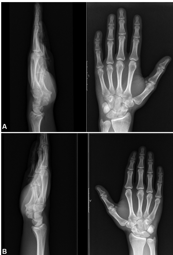
Fig. 4 (A) Radiografia do punho esquerdo às 12 semanas pós-operatório: redução do pisiforme mantida; (B) Radiografia do punho direito.

Às 12 semanas de pós-operatório, a radiografia de controle mostrava o pisiforme na sua posição nativa (► Figura 4 ). Aos 12 meses de pós-operatório, o paciente apresentava recuperação completa do arco de movimento do punho, e força muscular simétrica sem dor residual (► Figura 5 ) – Disability of Arm, Shoulder and Hand (DASH) escore 0; Patient-Rated Wrist Evaluation (PRWE) escore 0.