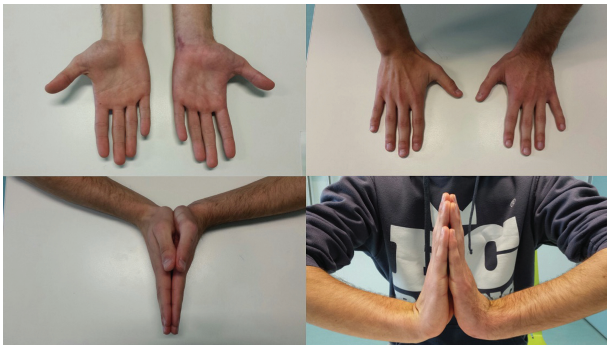
Fig. 5 Fotografia do paciente a demonstrar um arco de movimento simétrico.

traumatismo do punho em extensão, quer por contração muscular violenta súbita do FUC.