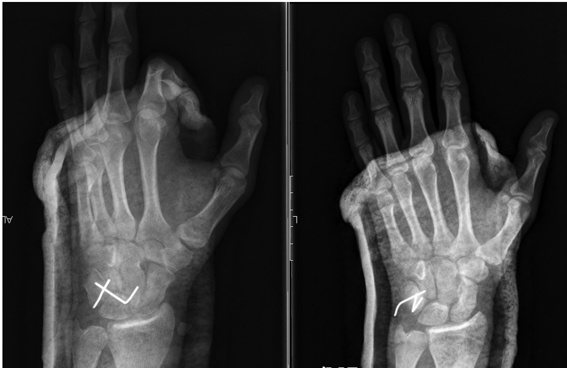
Fig. 3 Radiografia no período pós-operatório imediato a demonstrar a redução anatômica do pisiforme, fixado ao piramidal com fios de Kirschner.